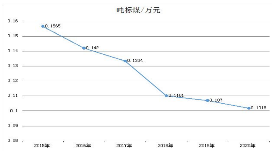
图1 单位地区生产总值能耗变化趋势

东城区持续疏解非首都功能，控制人口规模、降低人口密度，构建高精尖产业结构，提升城市精细化管理水平，能源利用效率显著提升，高效、绿色、低碳的经济社会发展格局初步形成。加强重点用能单位节能减排监督管理，推动重点行业、重点领域节能降耗，能耗总量增长总体可控，能耗强度持续下降。全区单位地区国内生产总值（GDP）能耗由2015年的0.14吨标准煤下降到2020年的0.10吨标准煤，呈逐年下降趋势，按2015年不变价格计算累计降幅达18.76%。以年均0.79%的能耗增长支撑了年均5.1%的经济增长。