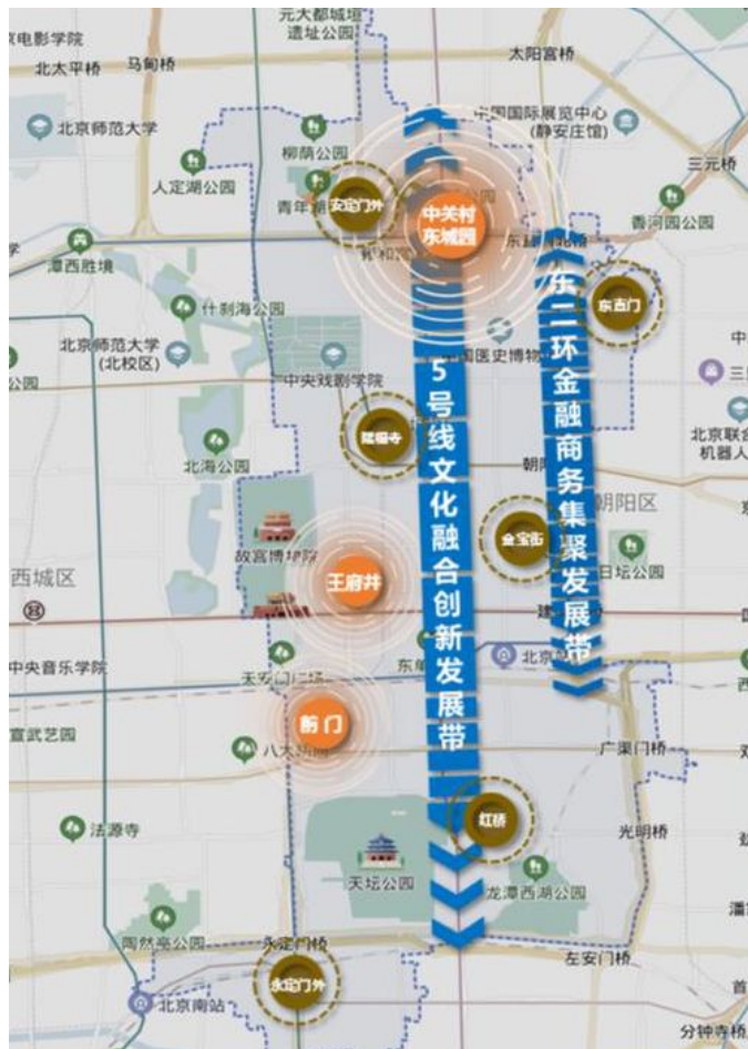
东城区“两带、三区、多点”产业空间布局图

通过城市更新挖掘存量产业空间潜力，形成产业发展新动能。打造“5号线”“东二环”两大产业融合发展带，建设“王府井”“前门”“东城园”三大重点功能区，围绕中轴线两侧，布局“金宝街”“永外”等多个重点产业集聚点。引导新兴产业向南部集聚，着力构建区域协调、功能互补、特色彰显的“两带、三区、多点”的产业空间新格局。