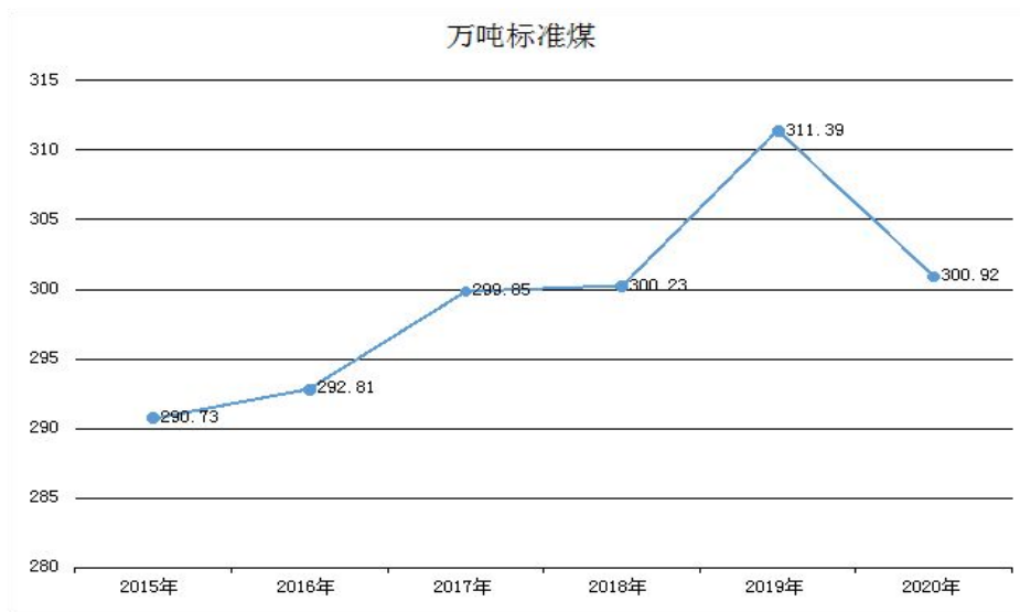
图2 能源消费总量变化趋势

第三产业用能和居民用能作为能源消费的主要来源，“十三五”期间都有所增加。随着经济持续发展，人民生活水平不断提高，“十四五”期间控制能源消费总量的压力依然较大，提前实现碳达峰目标任务艰巨。