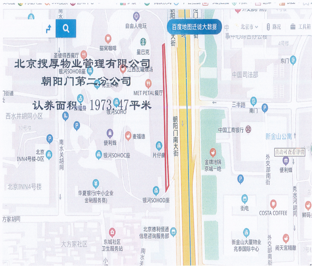
朝阳门 soho 三期（银河 soho）红线外绿地范围示意图