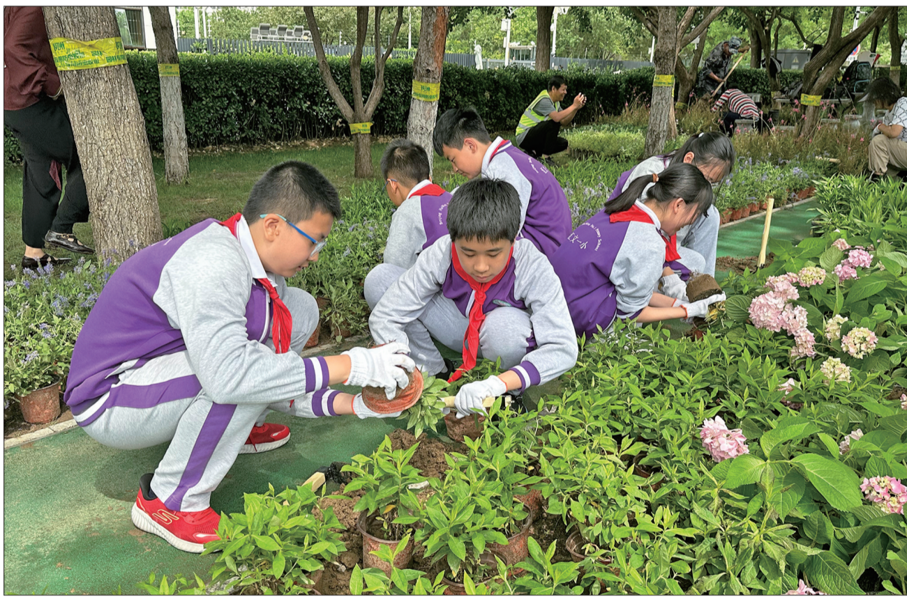
北京市汇文第一小学学生在中国海关博物馆微花园里种下花苗。

区级领导班子成员、东城园管委员会主任,区委、区政府各委、办、局,区级群众团体、双管单位、直属事业单位,各街道及区级重点企业领导班子成员,区委各巡察组组长、正处级巡察专员,区纪委监委领导班子成员,各纪检监察组织负责人参加。