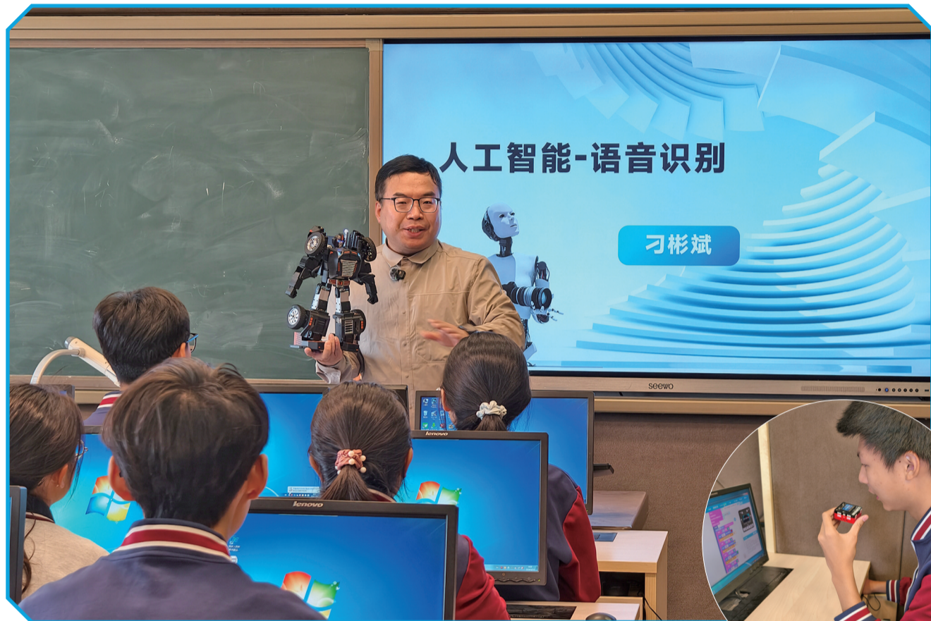
▲北京宏志中学教师将乐森机器人带到人工智能通识课课堂上。 ▲北京宏志中学学生向“乐动掌控2”主控板发出语音指令。