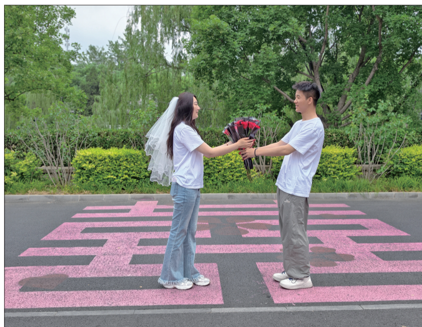
新人在玉蜓公园“甜蜜”主题公园打卡拍照。