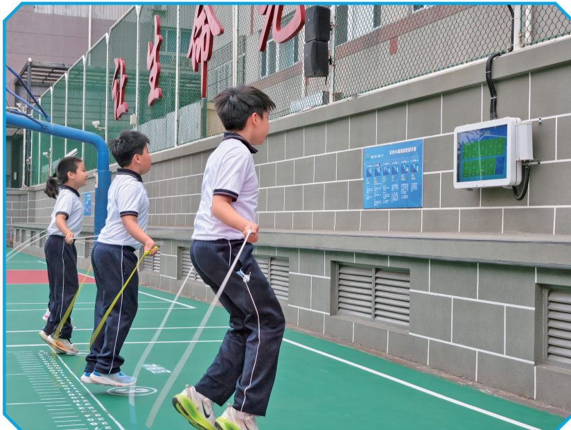
东城区灯市口小学学生通过AI体测屏练习跳绳。

近年来，东城区坚持以“健康第一”为引领，推动AI技术与体育教学、教研改进和学生发展支持融合应用。通过数据辅助课堂诊断、循证教研支持教师成长、常态赛事促进全员参与，持续推动体育与健康课程提质增效。