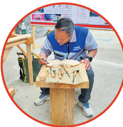
工作人员展示传统工艺。