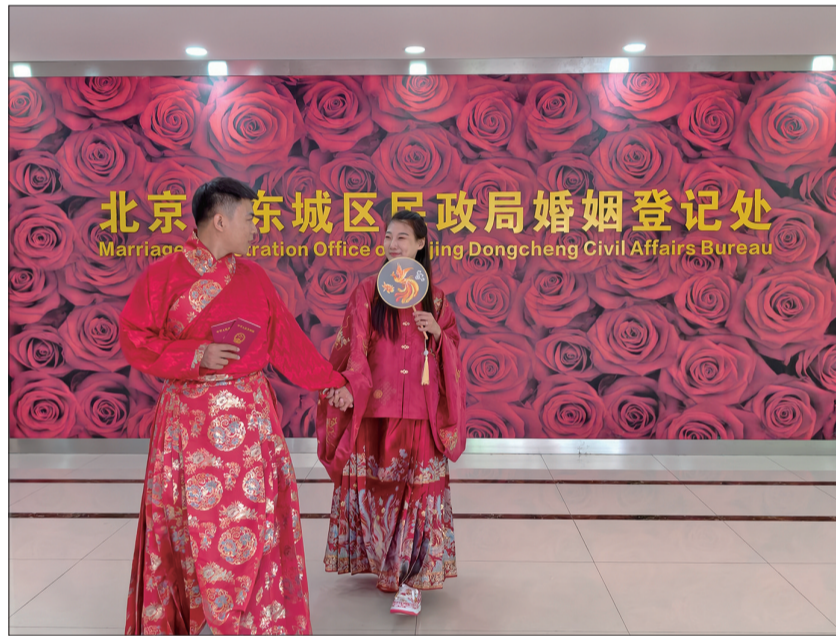
新人在东城区婚姻登记事务中心拍照留念。

东城区婚姻登记事务中心负责人表示，希望通过富有仪式感又践行文明新风的活动形式，引导新人树立文明健康的婚姻家庭观念，倡导文明向上、简约适度、内涵丰富、理性高雅的婚俗新风，共同营造文明、和谐的社会风尚。