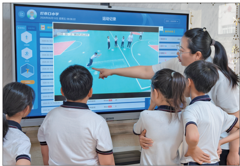
灯市口小学教师带着学生观看AI大屏幕上的跳远回放视频。