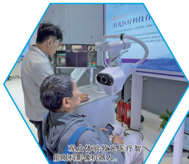
观众体验激光医疗智能眼科影像机器人。