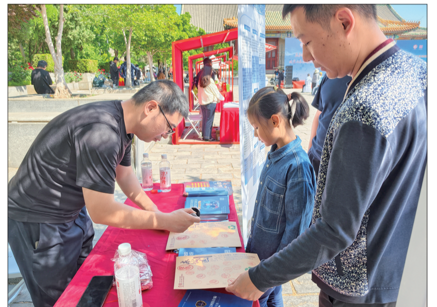
亲子家庭打卡集章。