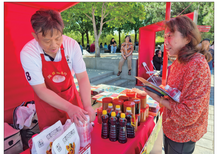
市民挑选心仪好物。

东城区第八届社区邻里活动由东城区委社会工作部主办,区委组织部、区委宣传部等22家单位联合主办,东直门街道承办。下一步,东城区将持续擦亮“正阳友邻”基层治理品牌,深入践行“崇文争先”理念,以社区邻里活动为载体,推动辖区单位、社会组织、新就业群体、志愿者与广大居民共同参与社区建设,以邻里温情厚植治理根基,以共建合力点亮幸福东城。