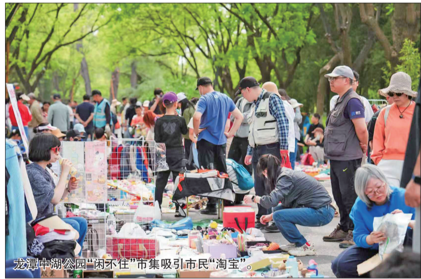
龙潭中湖公园“闲不住”市集吸引市民“淘宝”。