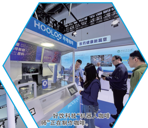
好饮科技“机器人咖啡师”正在制作咖啡。