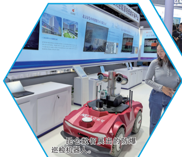
昆仑数智展出的防爆巡检机器人。