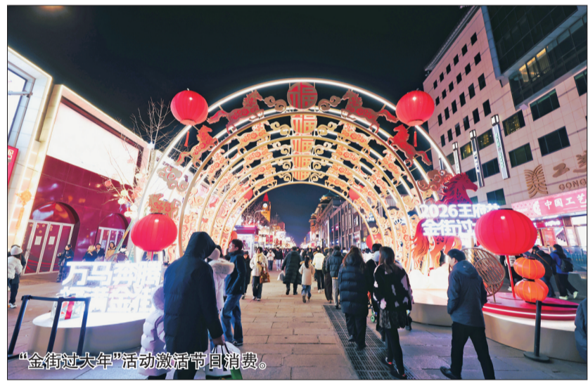
“金街过大年”活动激活节日消费。