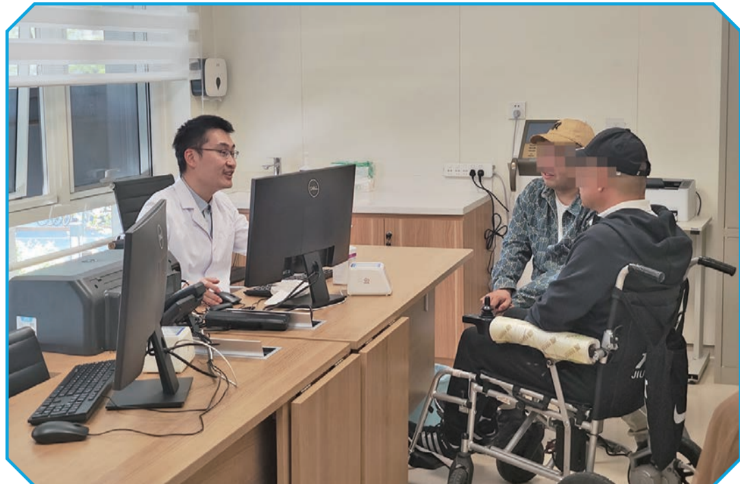
在北京协和医院脑机接口评估门诊,医生与患者交流问诊。