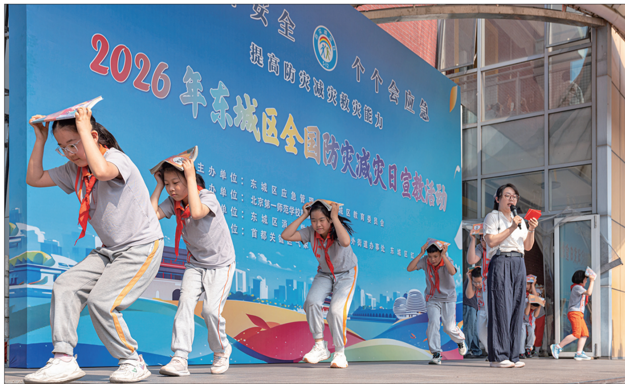
师生参加地震应急疏散实战演练。

以科技赋能国防科普,全方位、立体化展现北京国防动员发展历程、人民防空战备建设光辉岁月,北京人民防空历史文化馆既引领着观展者感受穿越时空的家国情怀,也让大家直观感受到国防实力的发展变化。场馆所在地“北京地下城”始建于1969年,历时10年完工,是目前北京为数不多保留完好的早期地道式人防工程。1980年,人们利用这处防空洞开起了前门工艺美术服务部,因入口处曾