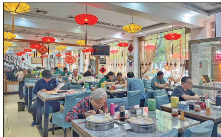
第一楼饭庄手工现包灌汤包吸引不少食客。