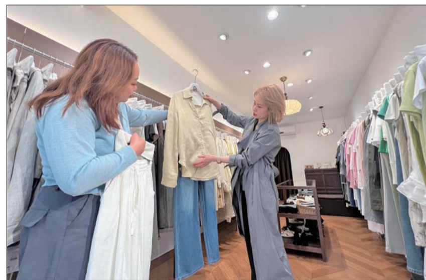
捌捌服装店主理人(右一)与店员探讨服装搭配。