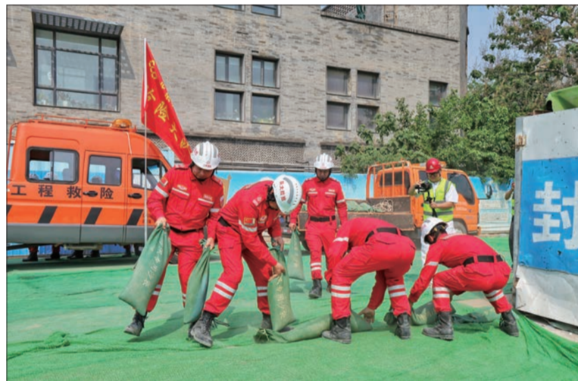
抢险组用防汛沙袋对坡道口进行围堰码放，有效阻挡雨水倒灌。

抢险大队还调集了L型活动式防洪板进行组装。这种复合材料挡水板能够独自站立，借助水的重量压在底部，水位越高反而越稳固。“平均每小时可安装800米，每块可抵御0.5米高的水位。”现场解说员介绍，安装完毕后，抢险人员随即架设高扬程水泵，将基坑积水快速排出，险情很快得到控制。