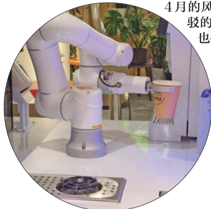
新华书店(花市店)新引进 机器人饮品机。

4月的风掠过崇文门的街巷，拂过明城墙斑驳的砖石，裹挟菜市场新鲜蔬果的香气，也捎来书店里墨香与咖啡香的交融。这里有六百年历史的厚重回响，有市井烟火的鲜活温度，有文化传承的生生不息，更有新时代消费与生活的无限可能。这个春天，崇文门以古今交融的姿态，向每一位来客发出邀约——我在崇文门等你。