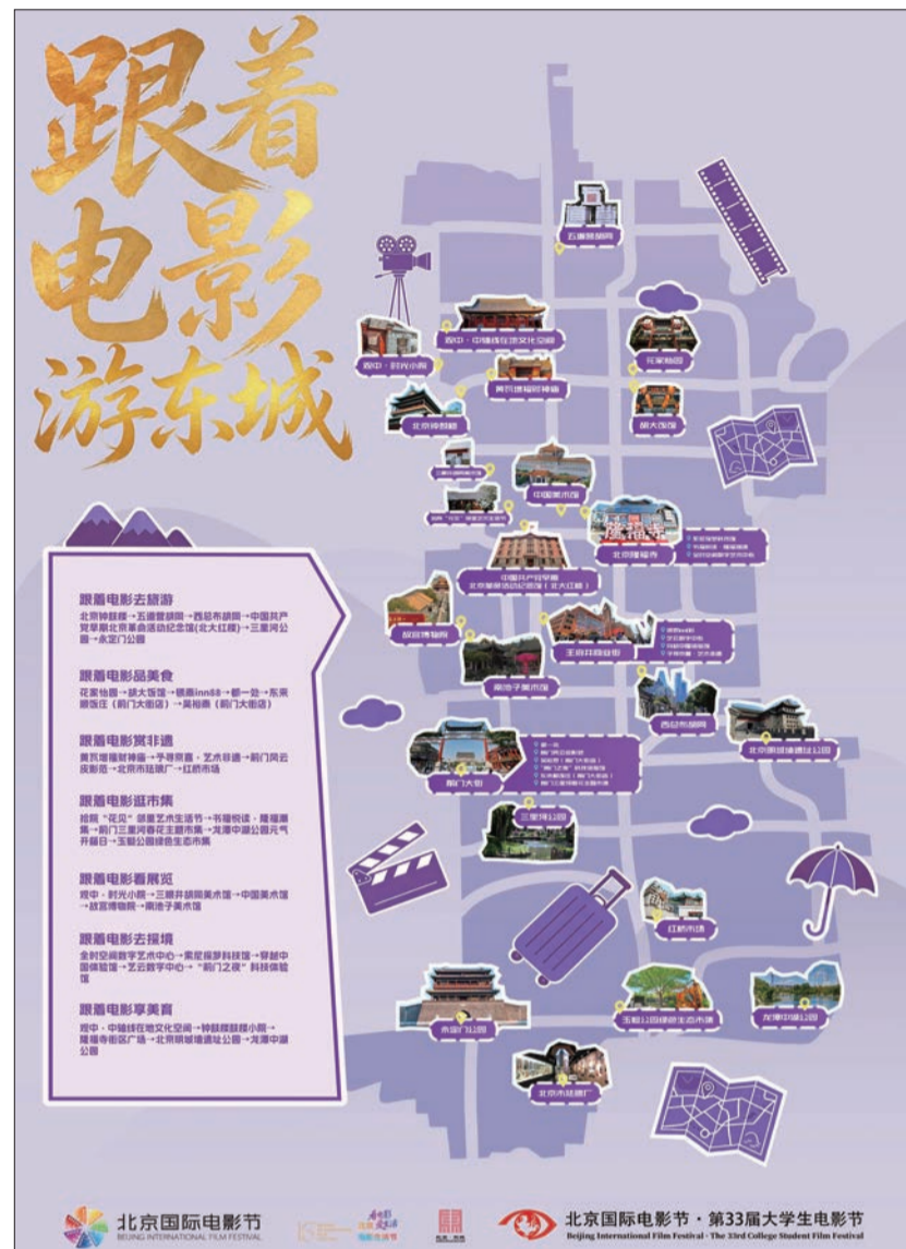
东城区推出“跟着电影”系列体验线路。

东城区深耕“电影+”融合发展模式，立足文化资源优势，盘活老城街巷、历史地标、艺术空间、商业商圈等多元载体，构建出“影视赋能文旅、文旅带动消费、消费反哺产业、产业滋养文化”的良性闭环。