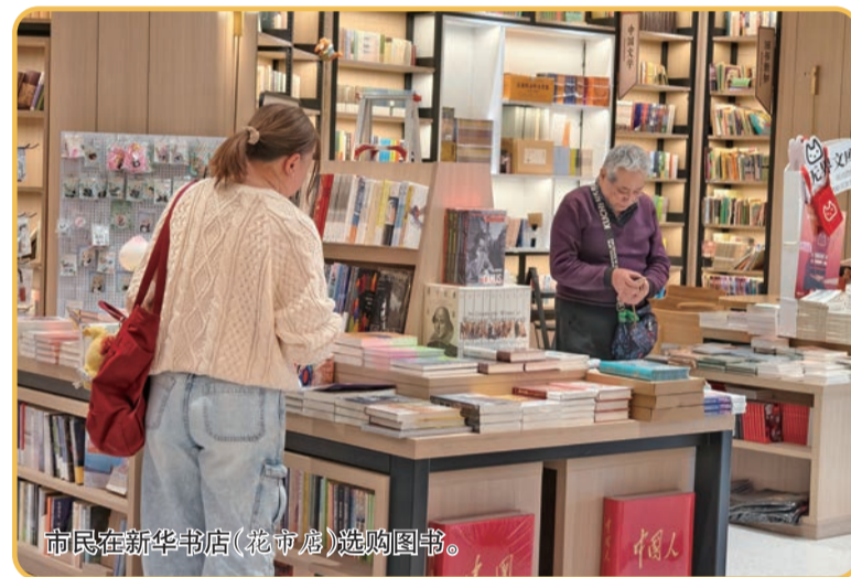
市民在新华书店(花市店)选购图书。

有着七十多年历史的新华书店(花市店)，自去年5月重装开业后，便让人们在传统书店有了新的认识。