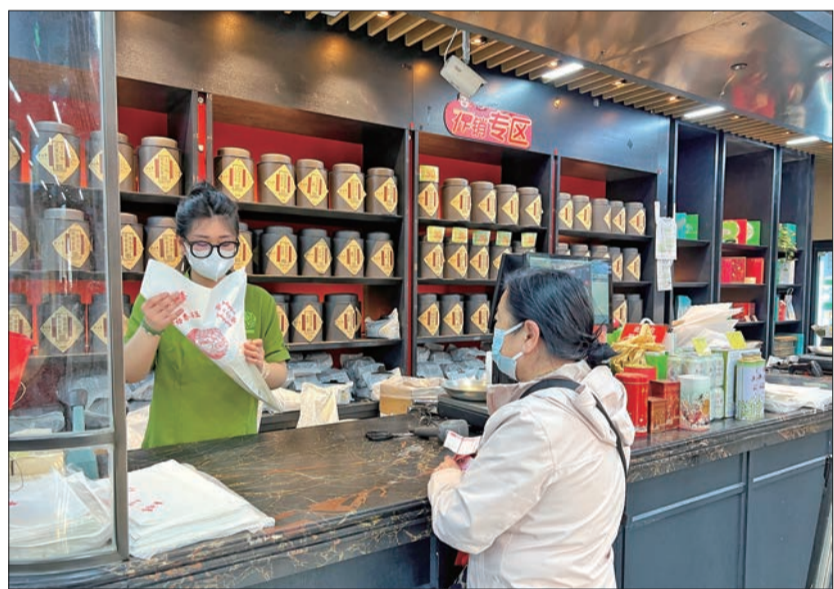
顾客在吴裕泰购买花茶。