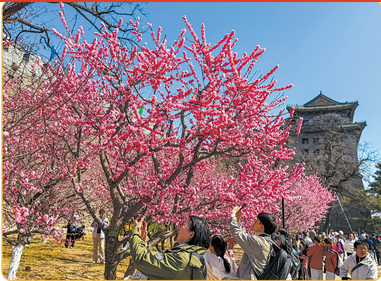
3月中下旬，北京明城墙遗址公园内梅花竞相绽放，不少市民游客前来赏梅、拍照。