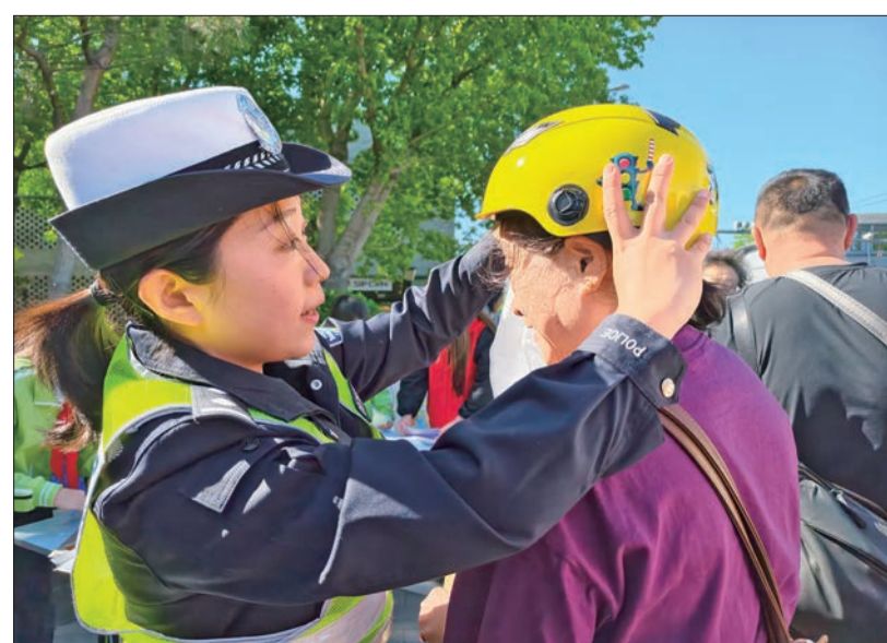
交警为市民讲解电动自行车头盔的正确佩戴方式。

从隆福寺街区的潮流地标、观中·中轴线在地文化空间到钟鼓楼的千年文脉,从明城墙遗址公园的静谧夜色到龙潭中湖公园的摩天轮下,5场特色放映、5部口碑佳作将陆续登场。活动将联动点位周边的市集、展览等多元业态,拓展文化服务场景,串联文化消费资源,释放文化外溢效应,形成“观影+打卡+消费”的闭环模式,以光影为媒搭建公共文化交流平台,在邻里间营造共同的文化记忆与精神家园,助力东城区文化建设提质增效。