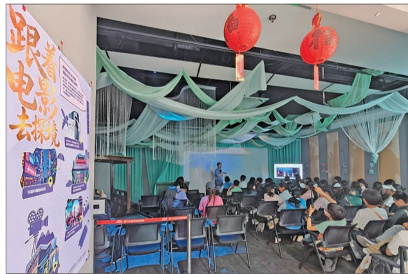
“跟着电影去探境”主题线路上的前门之夜科技体验馆。