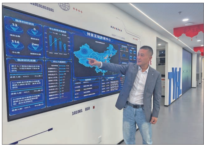
特医食品产业园特医产业数据展示。