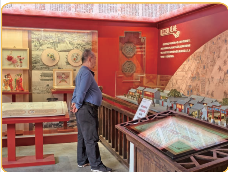
市民在曹雪芹故居纪念馆参观。

在中央礼品文物管理中心，“友好往来 命运与共——党和国家领导人外交活动礼品展”正在展出，670余件套中华人民共和国成立以来党和国家领导人在外交活动中受赠、赠送的珍贵“国礼”集中亮相，吸引了无数观众前来参观，一览“国礼”风采，感受中外友好往来的温度。