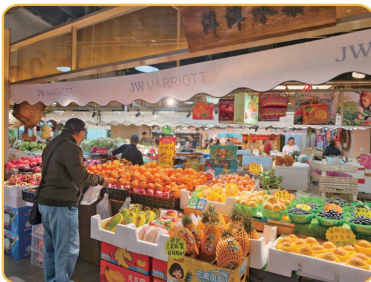
崇文门菜市场举办“心归烟火处·JW寻味之旅”限时快闪活动。