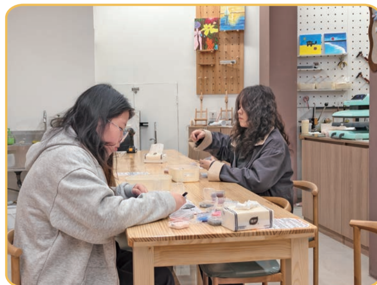
顾客正在“摸鱼手作”店制作拼豆。

崇文门，从来不是单一的地标。它是明城墙的砖石文脉，是曹雪芹的红楼笔墨，是老菜市场的烟火滋味，是新商圈的青春活力，更是书店、档案馆、礼品馆构筑的精神家园。我在崇文门等你，等一场城砖与书香的相逢，等一味烟火与时光的交融，共赴这场属于北京老城的温暖之约。