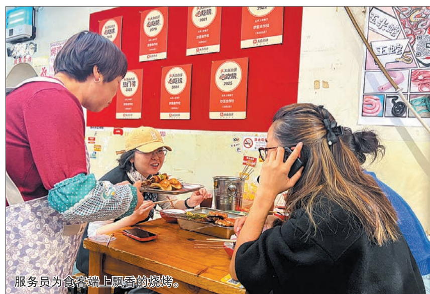
服务员为食客端上飘香的烧烤。