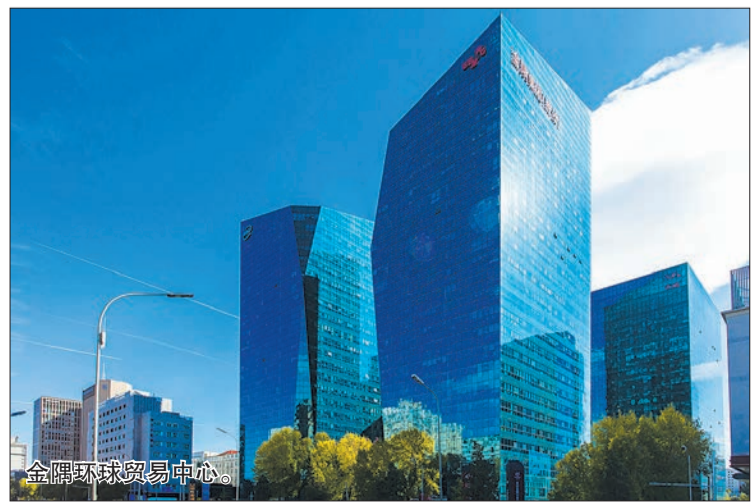
金隅环球贸易中心。