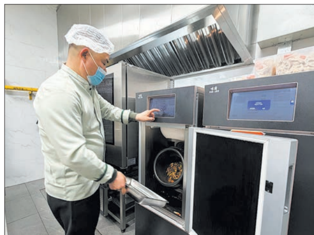
后厨工作人员将菜品盛出。