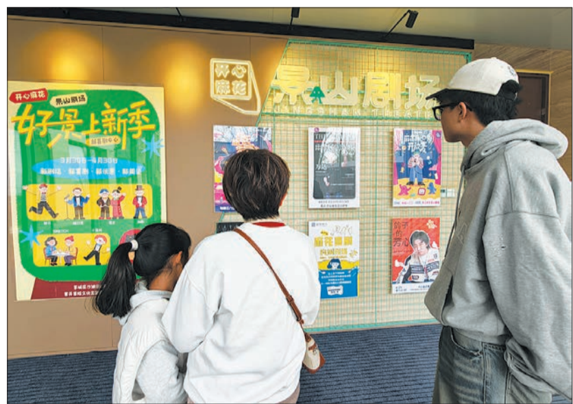
观众了解开心麻花景山剧场演出信息。