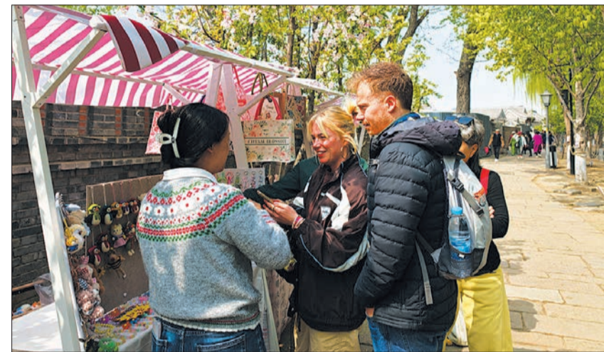
外国游客打卡三里河春花主题市集。