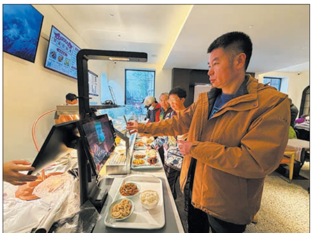
顾客就餐后进行自助结算。