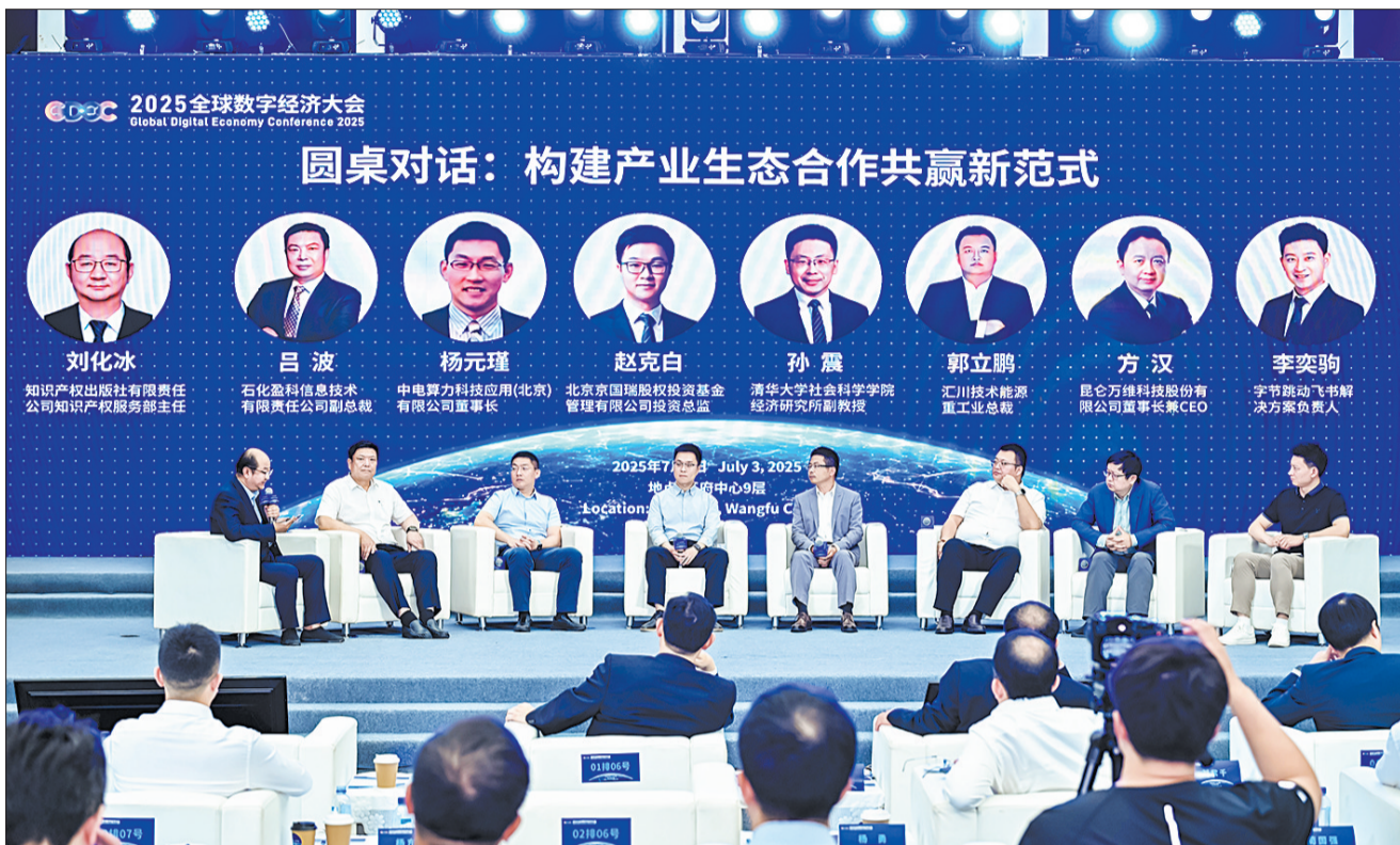
2025全球数字经济大会东城区主题论坛圆桌对话举行。

在产业空间布局上，东城区巧做“空间文章”，一方面打造硅巷科技产业集聚区，推进航星园、金隅环贸等九个产业组团建设，航天三院飞行技术科技园开园、东城数字科技大厦竣工招商，7家企业新挂牌认定硅巷科创园、硅巷驿站，空间承载能力持续提升；另一方面，统筹利用二环外10.8平方公里空间，打造安定门外、东直门外、永定门外“科创金三角”，聚焦芯片设计、健康医疗、央企数智化三大细分领域，推动产城融合高质量发展。截至目前，东城区已有30个高品质在租商务楼宇，24个在租产业园区，为人工智能企业提供了充足的发展空间。