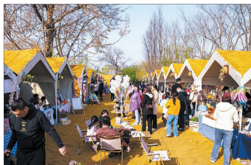
三里河春花主题市集吸引众多市民游客。

作用。完善矛盾纠纷化解体系,东城区综治中心实体化运行,建立平安建设协同联络机制。综合施策提升基层法治工作水平,落实年度“基层法治帮扶”和“法治明白人”工作任务双清单。全面深化普法与依法治理体系,“八五”普法工作圆满收官,进一步健全公共法律服务体系。 2026年是“十五五”开局之年,东城区将深入贯彻落实党的二十届四中全会精神和中央全面依法治国工作会议精神,加强法治政府建设的全局性谋划与整体性推进,全面推进严格规范公正文明执法,聚力打造一流营商环境,持续提升基层法治工作水平,为首都核心区奋力实现“十五五”良好开局提供有力法治保障。