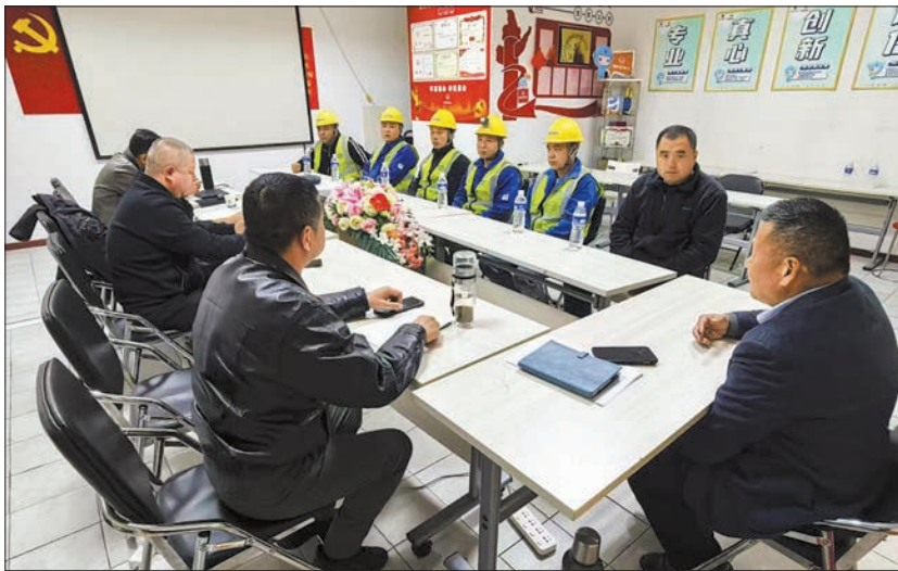
社区、物业、施工方协商工程排期,居民日常生活保障等事项。