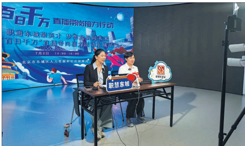
东城区开展直播带岗活动。