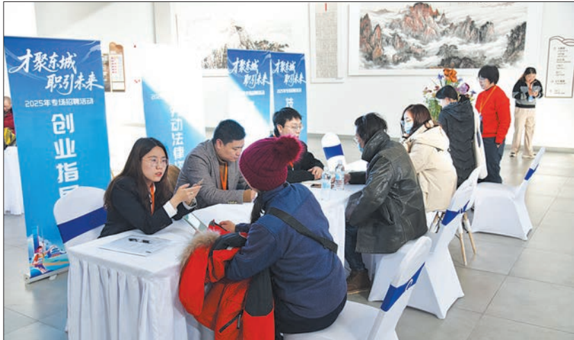
东城区举办金融专场招聘会。