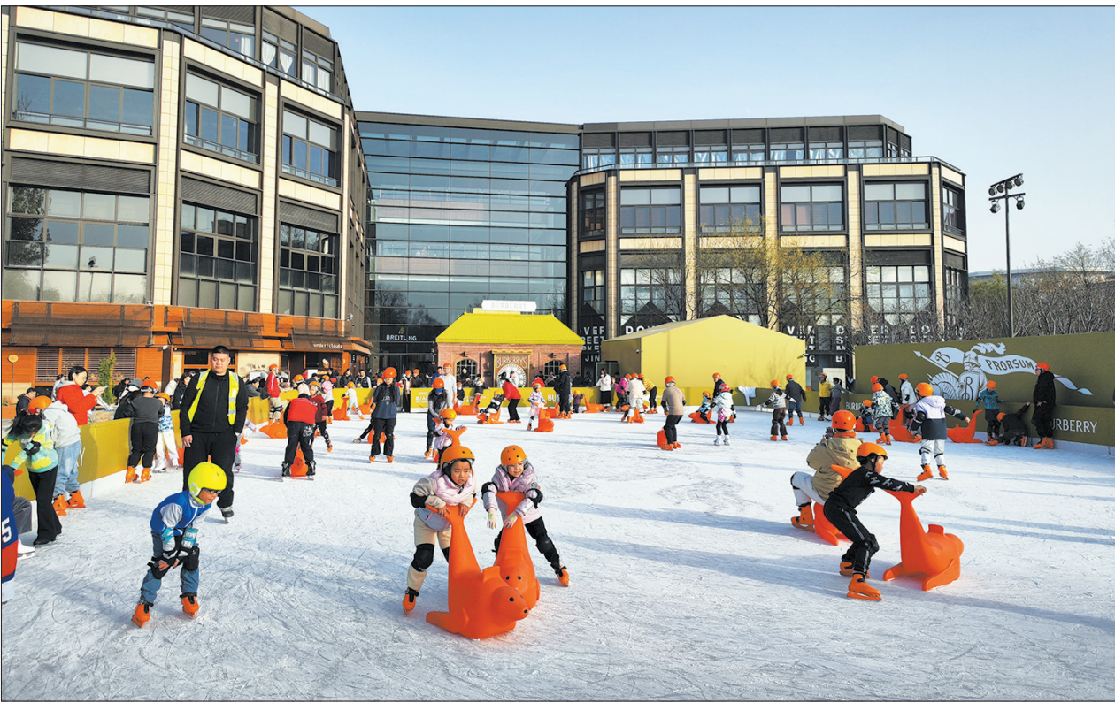
孩子们在王府中环冰乐园玩得不亦乐乎。

据了解,本届展演季以“文润东城 艺展华章”为主题,通过六大板块系列活动在全区掀起群众文化热潮,让文化发展成果真正浸润千家万户。未来,东城区将持续坚守文化惠民初心,深化群众共创机制,推动文化服务更精准贴合百姓需求,让千年文脉在全民共建共享的实践中焕发新的时代光彩。