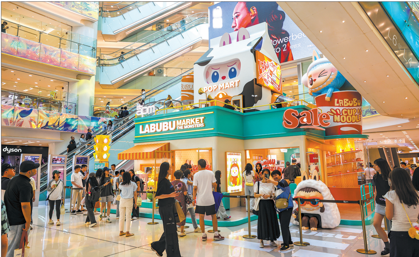
泡泡玛特 The Monsters 怪味便利店系列华北首展在北京 apm 举办。