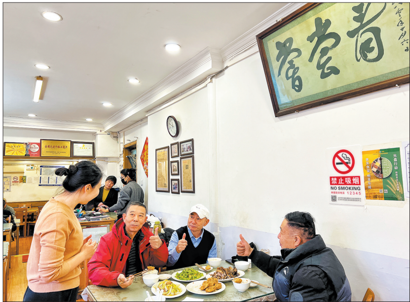
老顾客为蒜泥肘子的美味点赞。