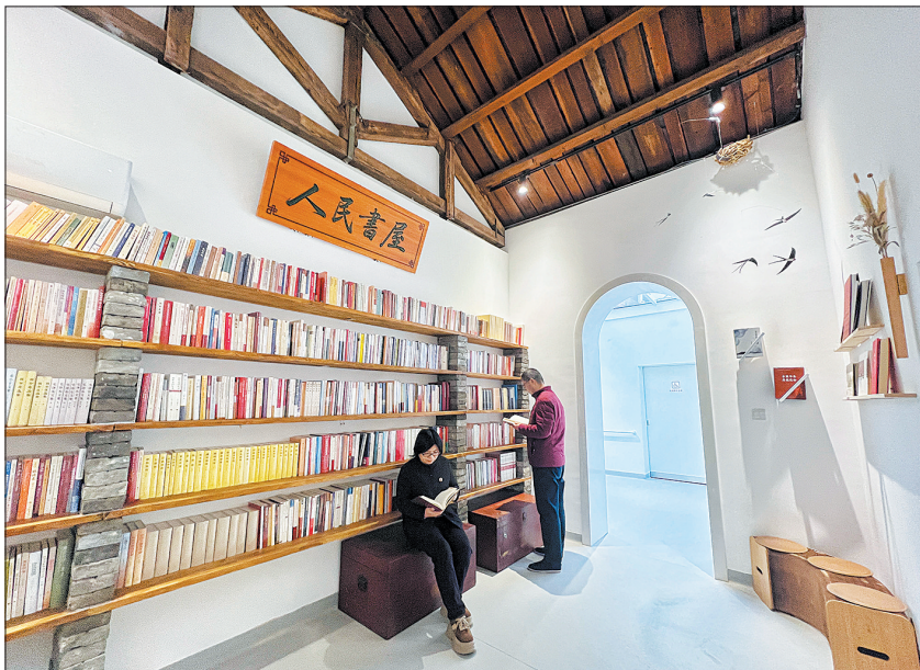
“人民书屋”提供了阅读空间。

此外，温馨家园还设有复合功能的“悦享空间”，今后将定期开展党建学习、文艺活动、读书分享会、书画培训等服务，形成全方位服务闭环。“改