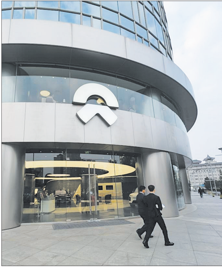
“蔚来中心|北京东方广场”是全球第一家蔚来中心。