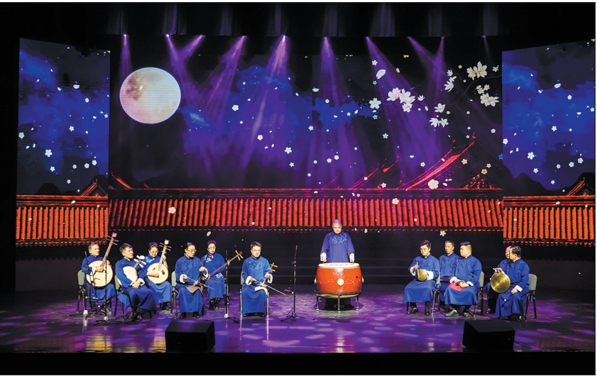
闭幕式现场上演京剧曲牌《夜深沉》。

作为王府中环与Burberry联手打造的时尚地标,这座冰乐园通过沉浸式的冰雪体验,将商业与文化艺术、时尚潮流紧密联结,深化了王府中环“高端生活方式目的地”的品牌形象,为市民游客提供了休闲消费新场景。未来,商场计划以“冰乐园”为IP化运营支点,进一步拓展季节限定的品牌联动力度,引入更多跨界艺术、科技互动或可持续主题的体验内容,将其打造为持续焕新的城市级文化活动品牌。