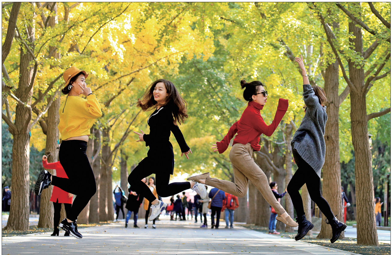
银杏叶黄的秋日美景吸引市民游客拍照打卡。

设计、完善政策支持体系、提供精准靶向招引,为品牌落地筑牢根基。据悉,2021年至今,东城区累计引入格拉夫、文华东方酒店、小米汽车全国首家直营店等各类首店、旗舰店、创新概念店540余家,涵盖高端零售、餐饮酒店、文化体验、新能源汽车等多个领域,品牌集聚度位居全国前列;成功承接北京时装周在商圈亮相时尚大秀、积家“精妙之艺”主题展览、迪士尼商店梦想之旅北京站“奇”妙快闪店等高能级首发首展活动。东城区消费能级显著提升。现象级首发经济消费场景持续出圈,区域消费吸引力不断增强,首发经济的“磁场效应”有效拉动消费,今年前三季度,东城区累计实现社会消费品零售总额1064.4亿元。