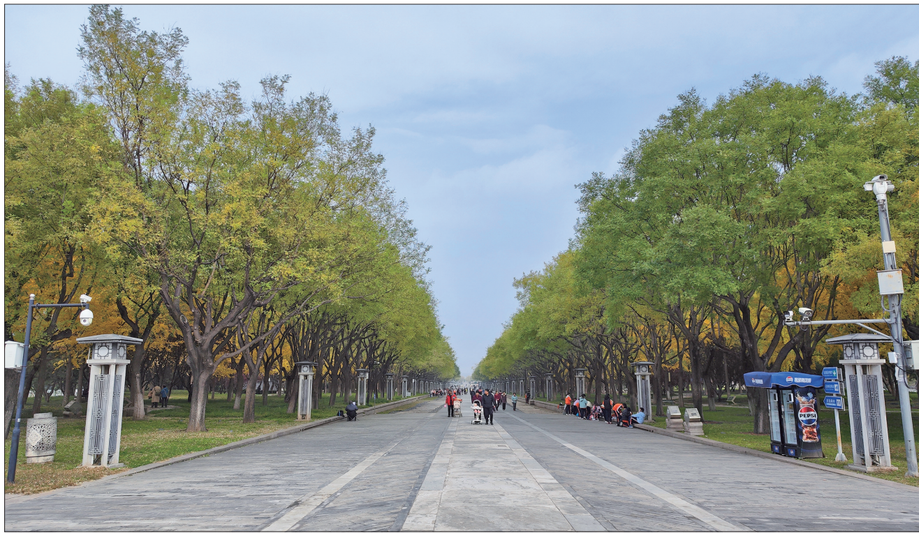
永定门公园秋色宜人。