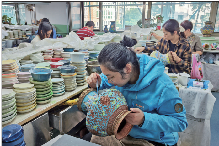
北京市珐琅厂的师傅们正在制作景泰蓝作品。