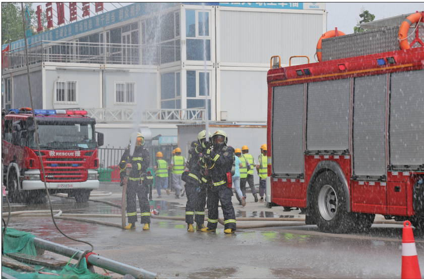
东城区开展消防应急救援综合演练。

文化辐射与科技创新相结合,培育智慧应急生态圈。习近平总书记强调,推进应急管理科技自主创新,依靠科技提高应急管理的科学化、专业化、智能化、精细化水平。当前,信息化数字化技术高速发展,在提高应急管理监测预警能力、辅助指挥决策能力、社会动员能力等方面作用愈加突出,已经成为驱动应急管理现代化的重要引擎。区应急局坚持“人民至上、生命至上”,动员为了人民,动员依靠人民,充分调动社会各方面积极性,