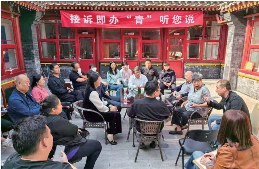
街道组织青年干部与诉求群众沟通交流。

以经验为镜鉴,探索治理创新之路。安定门街道的实践,为新时代基层治理提供了宝贵启示。建强联动班子,以“源头管控”防范失管。以“实负责制”为核心,处级领导包社区、机关干部包街巷、社工包管片、群众包楼