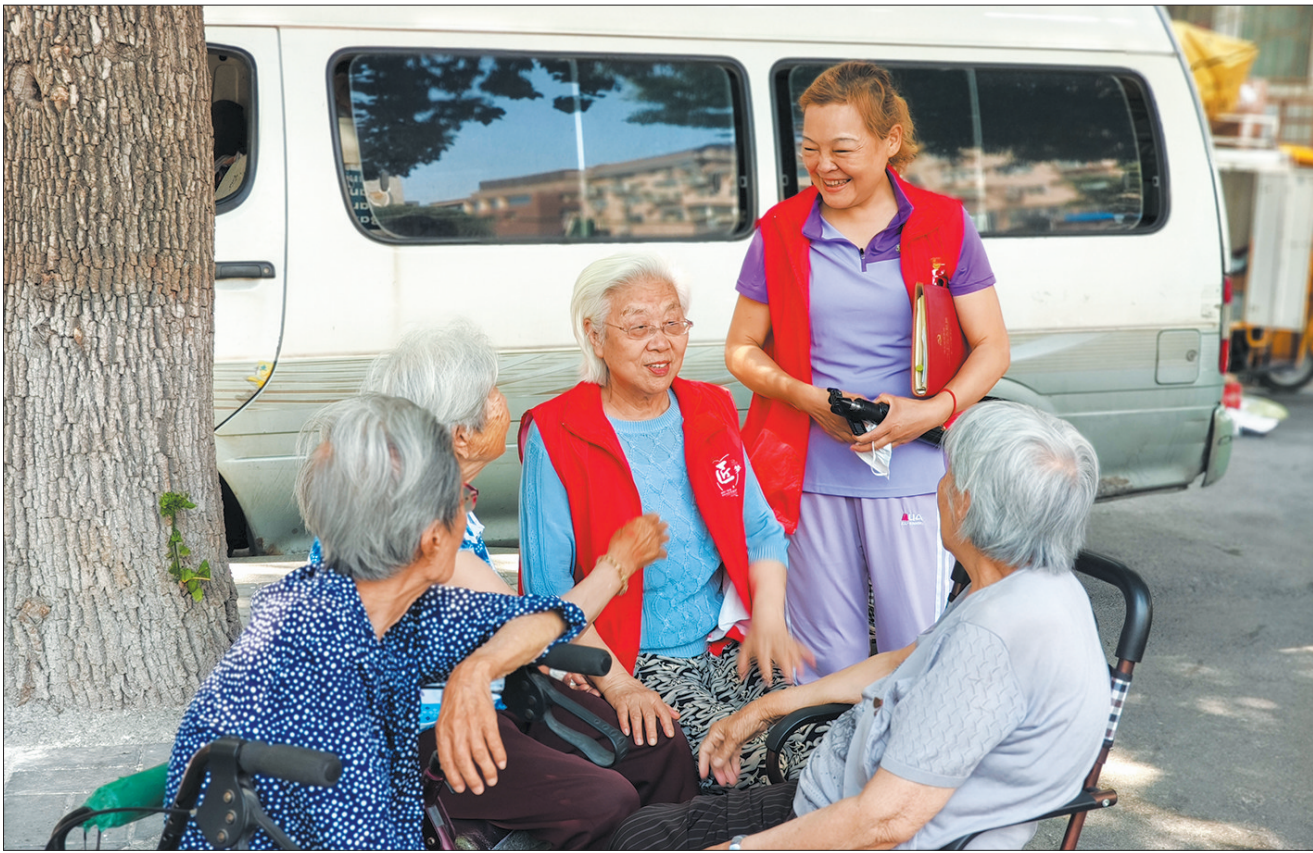
朝阳门街道“潮街坊”的志愿者关心问候辖区老人。