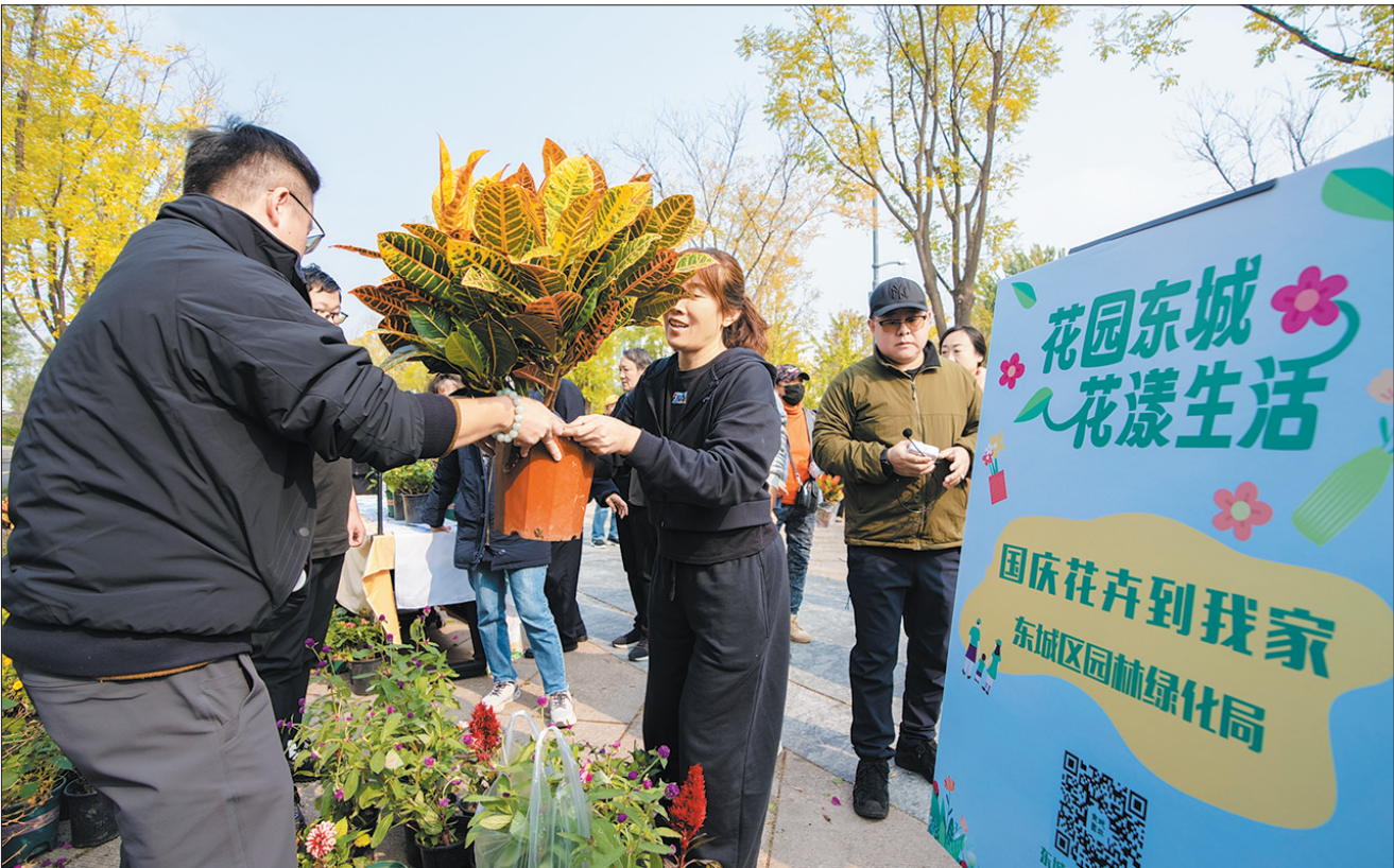
市民在南中轴御道广场免费领取鲜花。

此次国庆花卉分享活动,让参与环境布置的花卉在街巷间延续、在阳台上盛放、让美好在人心间传递。下一步,东城区园林绿化局将持续拓展园林园艺活动形式,让大家人人动手做园丁,将园艺融入幸福生活,营造花草为伴、拥抱自然的生活新风尚。