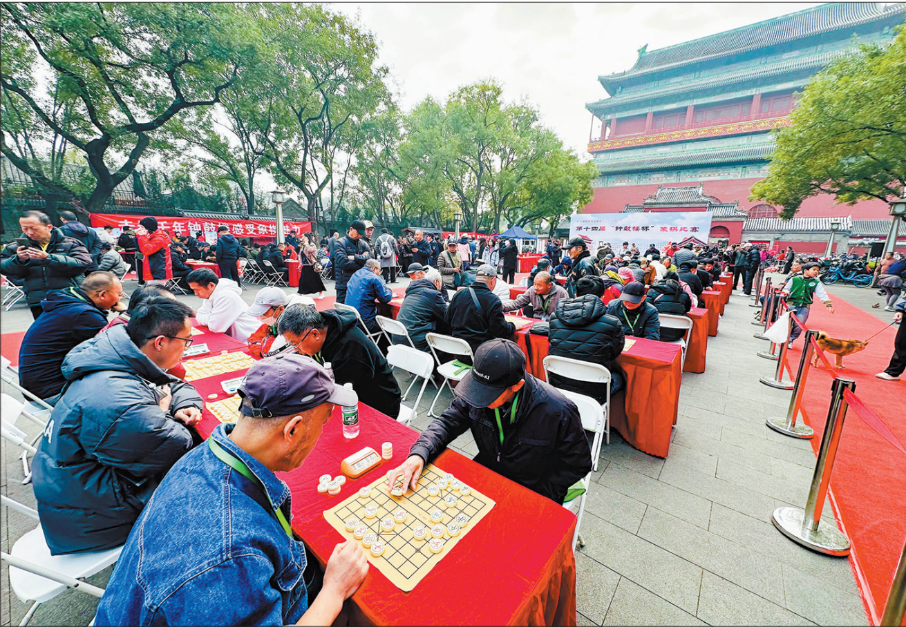
比赛现场,棋手们进行智慧对决。

心、天津市体育竞赛和社会体育事务中心、河北省体育局棋牌运动中心共同指导,东城区体育局、安定门街道联合主办,东城区社会体育管理中心、北京子合科技有限公司承办,并得到北京钟鼓楼文物保管所、北京京味时代文化发展有限公司的大力支持。赛事延续公益助农模式,联动多地设立特色农产品展台。来自山西屯留的小米、内蒙古的奶制品等特色农副产品在展台亮相,吸引不少棋手和观众驻足选购。