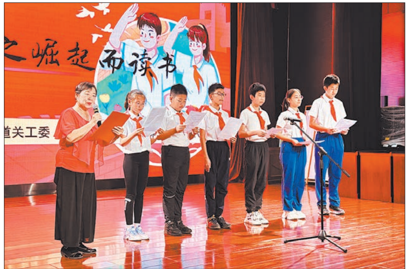
东城区“五老”宣讲团走进东花市街道宣讲。