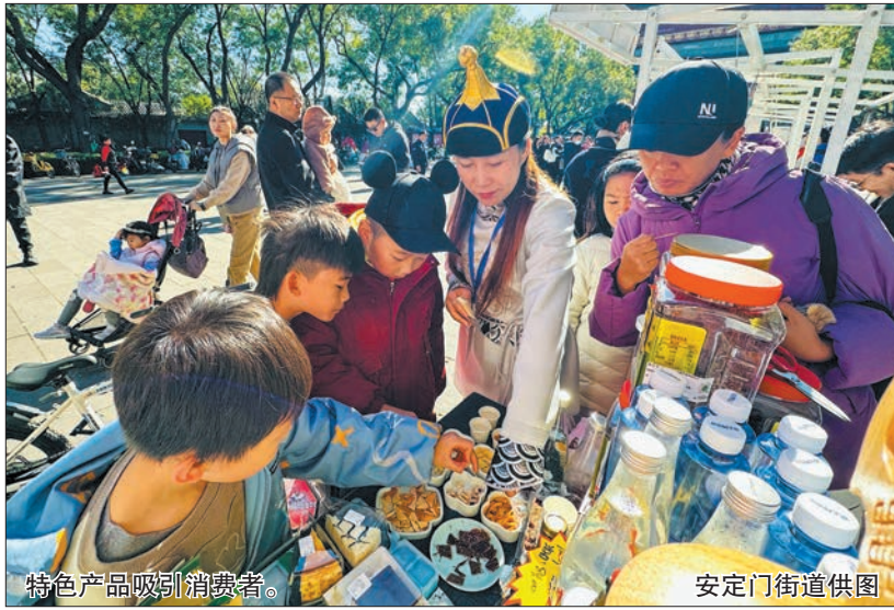
特色产品吸引消费者。

时尚生活展区,精准契合年轻群体消费偏好,红桥市场珍珠非遗盘扣胸针、顺时而饮时令养生茶饮、利生体育商厦体育用品等产品集中亮相。文旅与特色产品展区,黄瓦财神庙文创衍生品,将东城历史文脉与现代设计深度融合,为文旅消费赋予新内涵。还有阿尔山、当雄、郎阳等东城区支援合作地区企业入驻,带来特