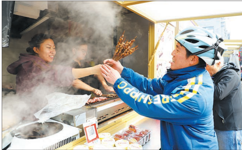
新兴领域企业青年逛吃“前门·中华美食荟”。

东城团区委联合天街集团,为新兴领域企业团员和青年代表发放了专属消费券。青年们拿着专属消费券逛吃“前门·中华美食荟”,从鲜美的新疆抓饭到爽口的云南酸角汁,从西北拉面到广式早茶,各地驻京办事处、驻京联络处精心准备的特色小吃琳琅满目,不仅唤醒青年们的味蕾记忆,也以美食暂慰思乡之情。现场,青年们在品尝与交流中分享家乡故事、增进彼此了解,进一步增强对东