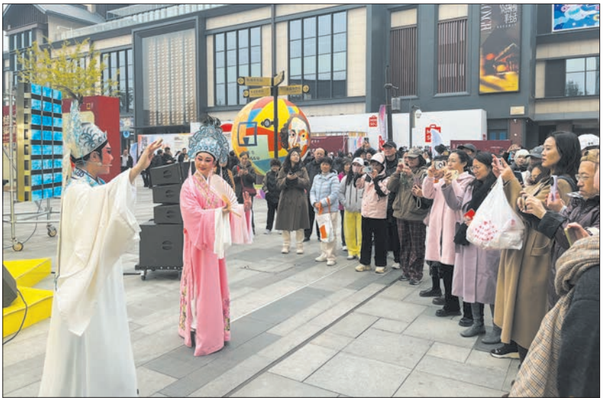
“2025隆福户外戏剧汇”打造沉浸式演艺活动。

推动皇城景山、西总布街区等项目试点院落形成更多可视化成果。按时保质完成环天坛周边等5个城市画廊建设任务,加快南北河沿大街沿线周边(一期)环境整治提升项目建设,持续优化学医景商等地区交通品质。要扎实推进中小学校领导体制改革,加快相关校区等重点工程建设。深化医药卫生体制改革,推进综合医联体和紧密型城市医疗集团建设,拓展家庭医生签约服务,强化基层卫生服务能力。要持之以恒推进全面从严治党,不断增强党的政治领导力、思想引领力、群众组织力、社会号召力,充分发挥党建引领作用,为经济社会发展提供坚强保障。