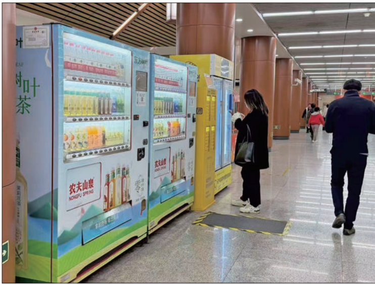
市民在地铁站内的自助售货机前选购商品。