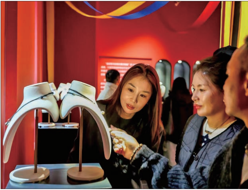
观众观看第12届嘉德艺术周展览。

此次活动由区委教育工委、团区委、区少工委主办,北京市东城区板厂小学承办。活动严格遵循少先队入队仪式规程规范,为东城少先队组织注入了鲜活的新生力量。同时,通过沉浸式的仪式教育,在队员们心中播下了爱党、爱国、爱人民的红色种子。