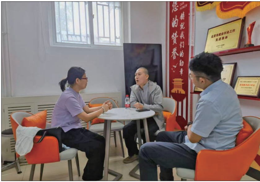
工作人员在政务会客厅为辖区企业提供咨询服务。

在东城,“胡同里的红色讲坛”已成为融合“校地共建、文艺融合、群众参与”的亮眼品牌,不断延伸着理论宣传的触角。未来,东城区将坚持以习近平新时代中国特色社会主义思想为指导,深入贯彻落实党的二十大及二十届二中、三中全会精神,持续用党的创新理论武装党员干部、教育人民群众,以“理”响东城理论宣传品牌为载体,深挖区域丰厚的文化底蕴,拓展宣讲的深度与广度,让红色基因融入城市肌理、汇入百姓生活,在奋进新时代的伟大进程中,绽放出更加璀璨夺目的真理光芒与精神力量。