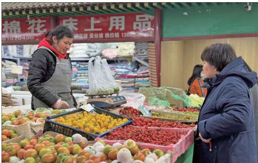
市民在距离地铁磁器口站不远的特吉特菜市场选购果蔬。