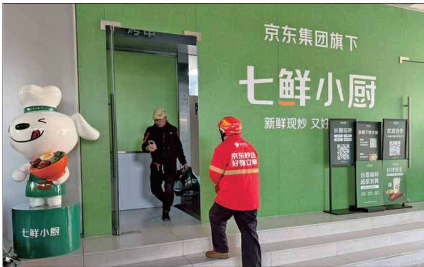
外卖骑手在地铁广渠门内站附近的七鲜小厨长保大厦店取餐。