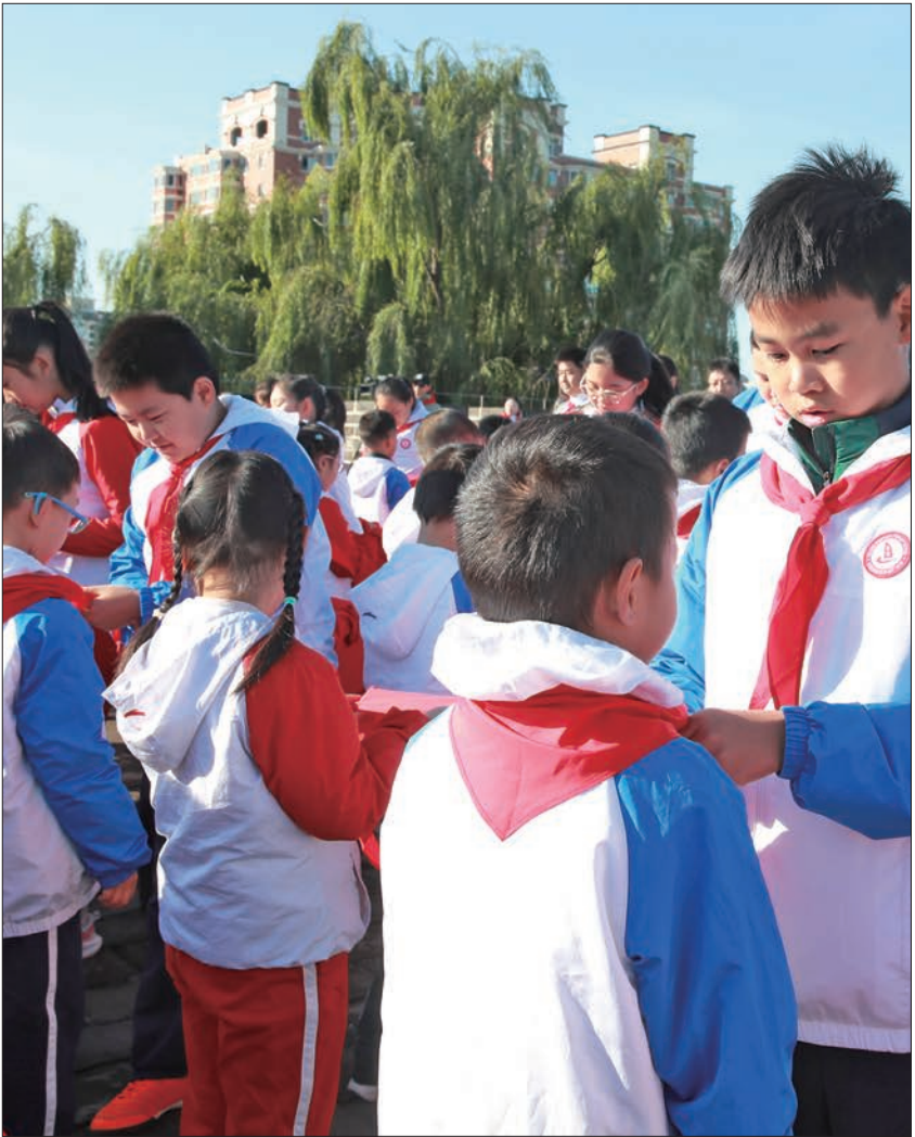
老队员代表为新队员佩戴红领巾。