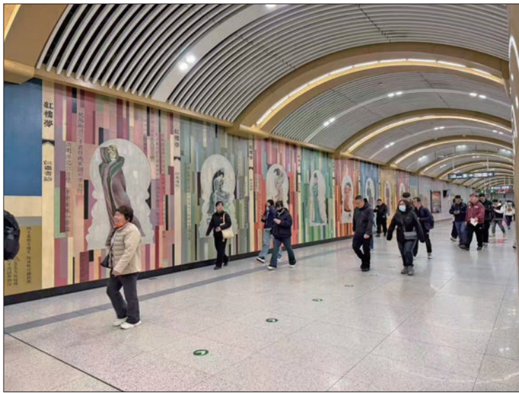
磁器口站厅内的《红楼梦》文化墙。