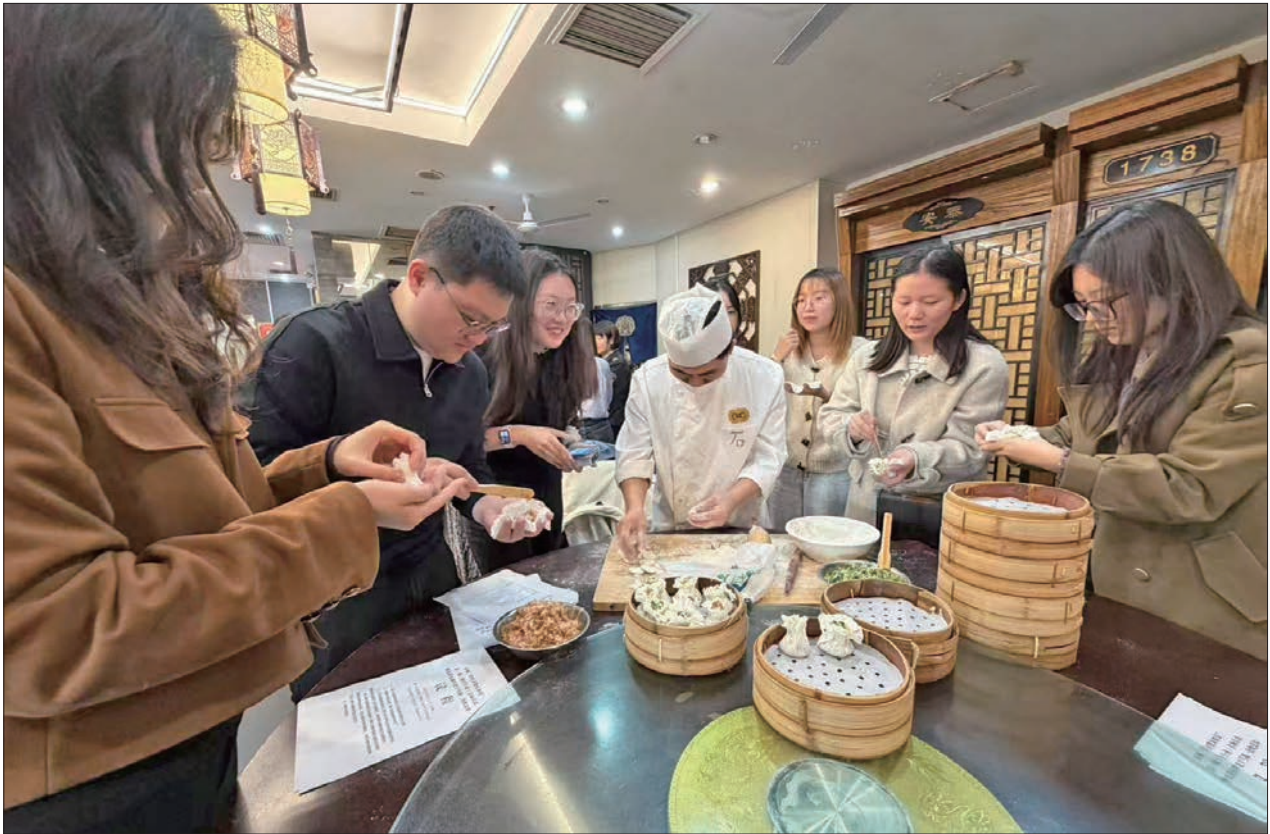
在都一处烧麦馆前门店,青年消费体察员体验制作烧麦。

据悉,东城区将继续围绕餐饮、零售、文化娱乐等青年关注度高的领域开展消费体察活动,培育更多消费新场景,为东城经济高质量发展注入青春活力。