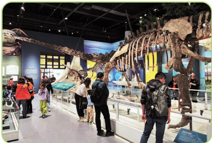
市民游客在国家自然博物馆参观。