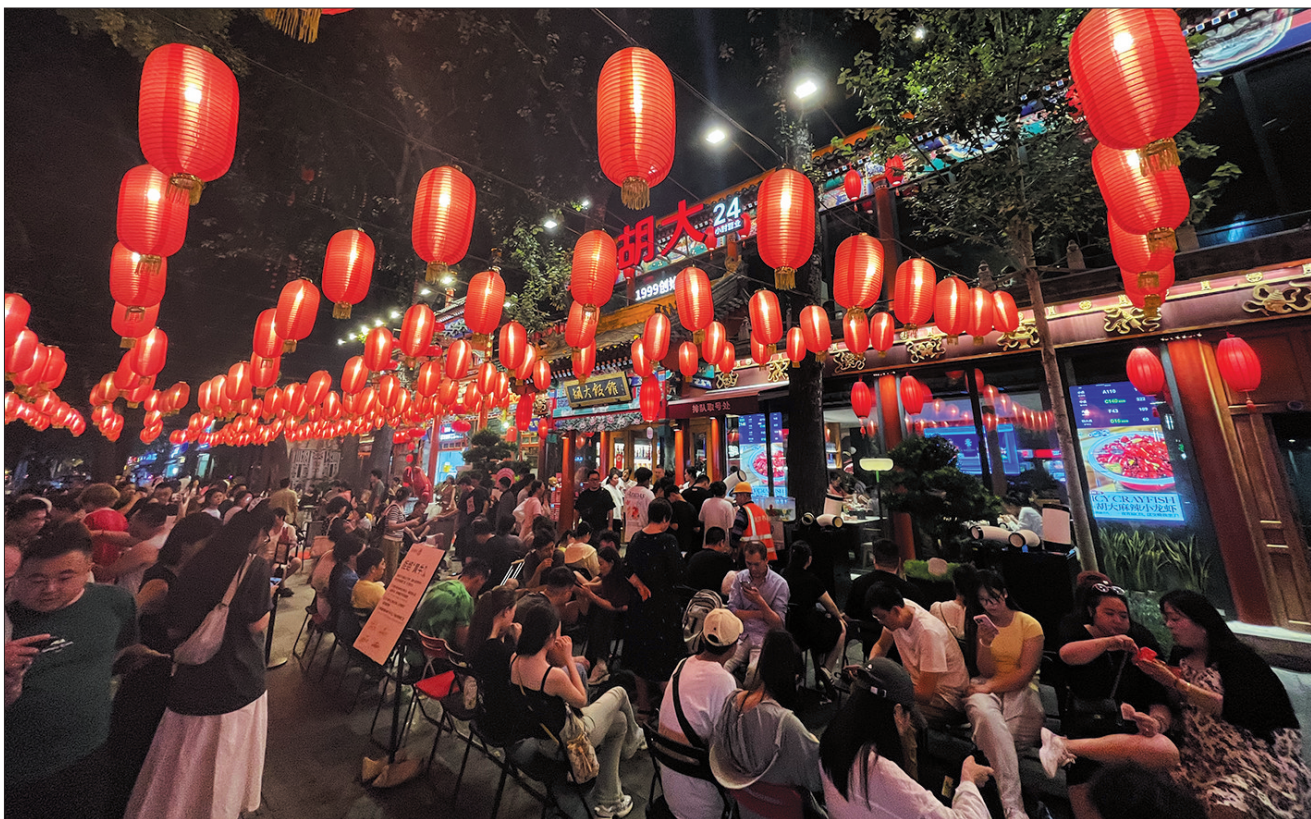
2024北京国际美食荟·簋街不夜节为东城夜间消费增添活力。