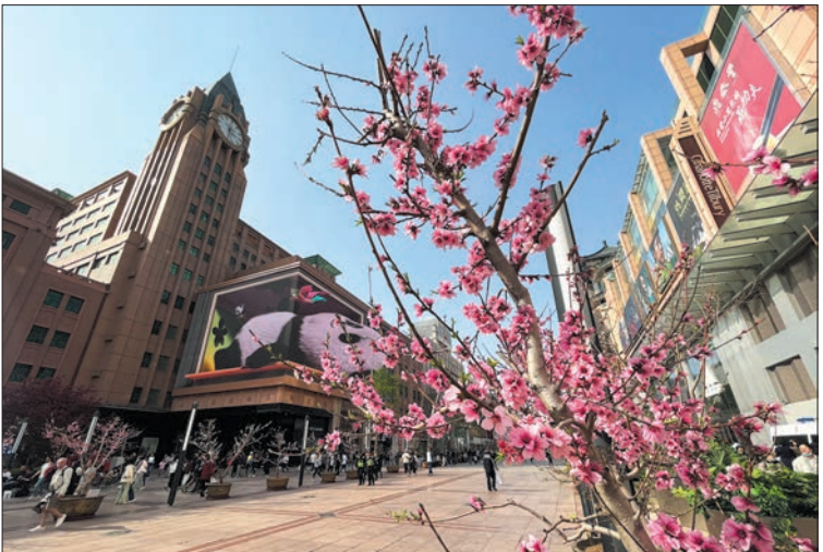
2024“香”遇王府井系列活动之“王府井桃花季”活动扮靓金街。