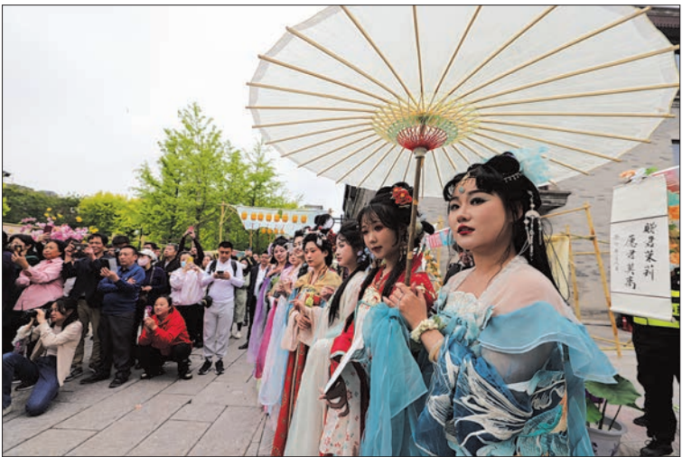
“2024前门国风节”吸引了众多市民游客。

除了各大商圈的升级改造,东城区全面完成了一刻钟便民生活圈建设。东城区入选全国第一批全域推进先行试点,并以全优成绩通过民生实事生活圈验收,提前一年完成全部建设任务并实现社区全覆盖,“出门步行几分钟就能满足日常生活的需求”已成为东城居民真实的切身感受。