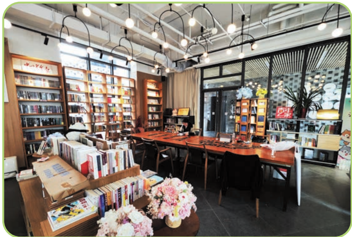
位于布巷子胡同的BaoBao·两岸·青年书店。