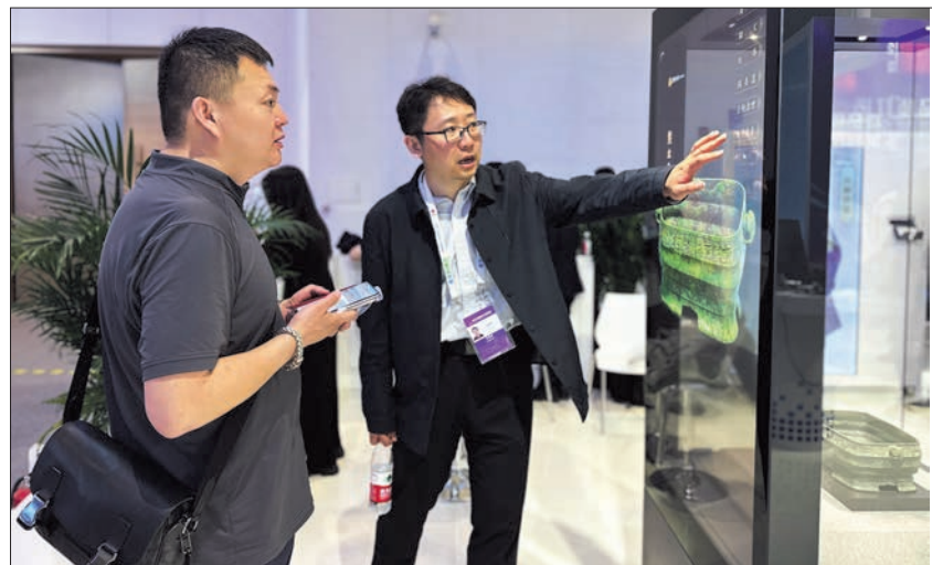
观众参观保利文化的“时间典藏”多功能文保全息柜。