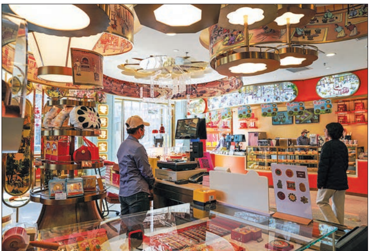
北京稻香村零号寻宝馆成为新晋热门打卡地。