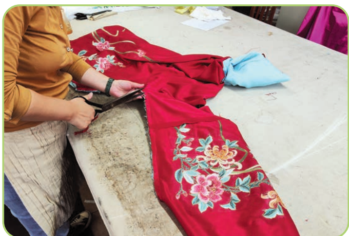
北京剧装厂工作人员制作戏服。