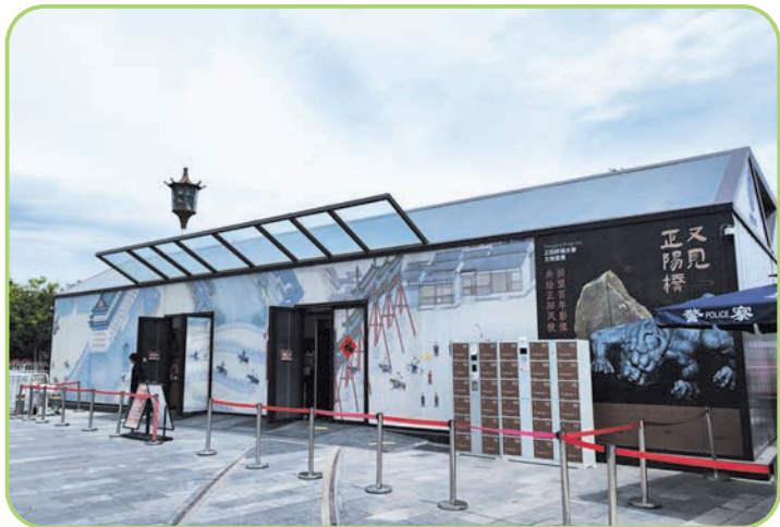
正阳桥考古遗址方舱。