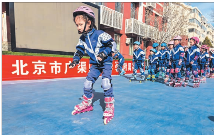
北京市广渠门中学附属花市小学低年级学生在体育课上学习轮滑技巧。