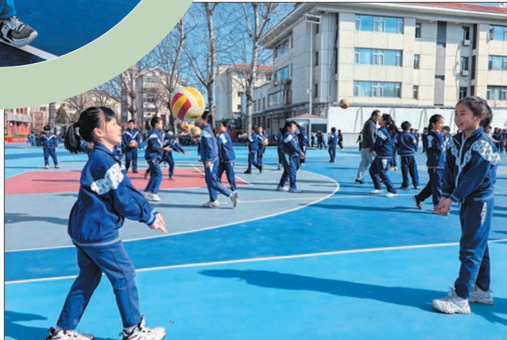
北京市广渠门中学附属花市小学高年级学生在体育课上打排球。