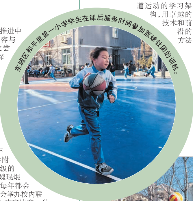
东城区和平里第一小学学生在课后服务时间参加篮球社团的训练。

府学胡同小学自2002年起在四年级开设轮滑课程,2018年起将冰雪项目作为体育课的必修内容。北京市第五十五中学在初中和高中开设了冰壶社团、冰壶选修课程以及冰壶模块体育课程,每学期开设社团课总数为18节,选修课程总数为64节,保证了非毕业年级100%参与冰上项目活动。