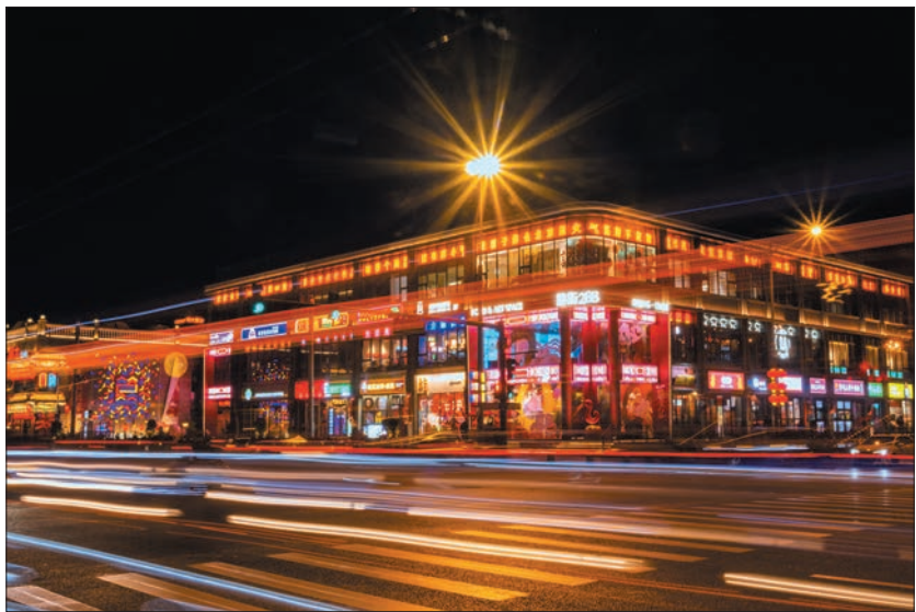
夜幕中的簋街流光溢彩,熠熠生辉。