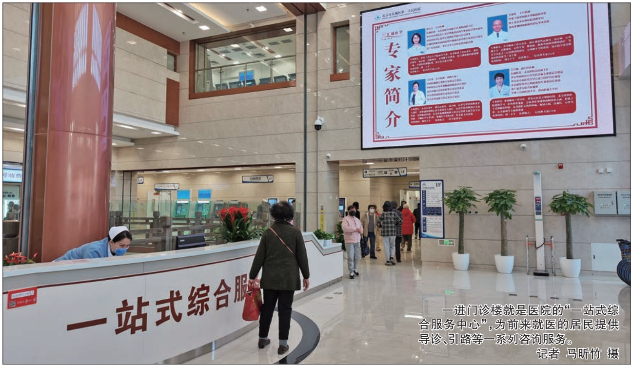
一进门诊楼就是医院的“一站式综合服务中心”,为前来就医的居民提供导诊、引路等一系列咨询服务。

东城区第一人民医院的这次整体搬迁,标志着这家历史悠久、深受居民信赖的医疗机构迈入了全新的发展阶段。未来,医院将继续秉持“以患者为中心”的理念,不断提升医疗技术和服务水平,为百姓健康保驾护航,为东城区医疗卫生事业发展作出更大贡献。