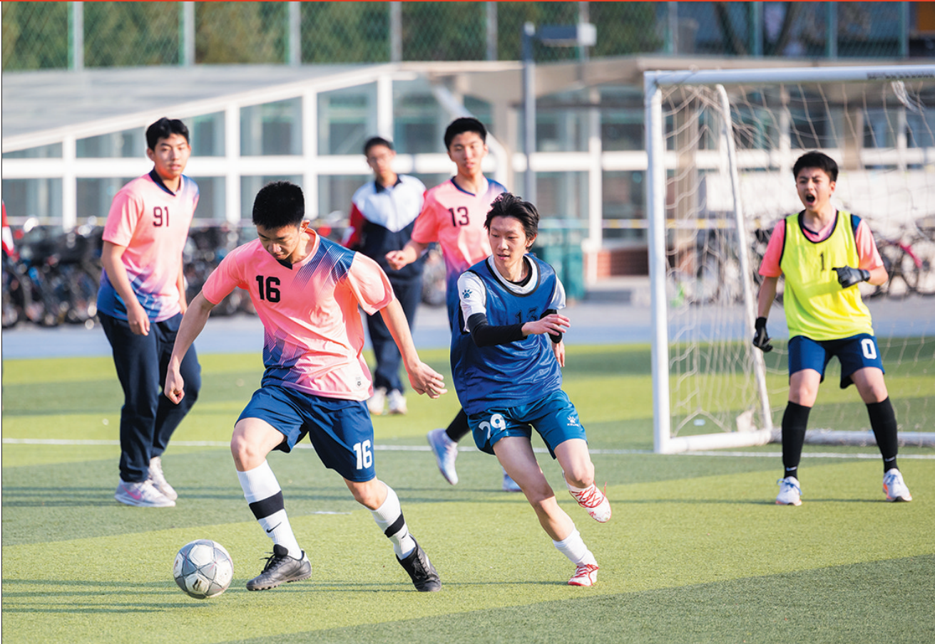
在北京市第五十五中学的体育节上,学生们进行足球比赛。