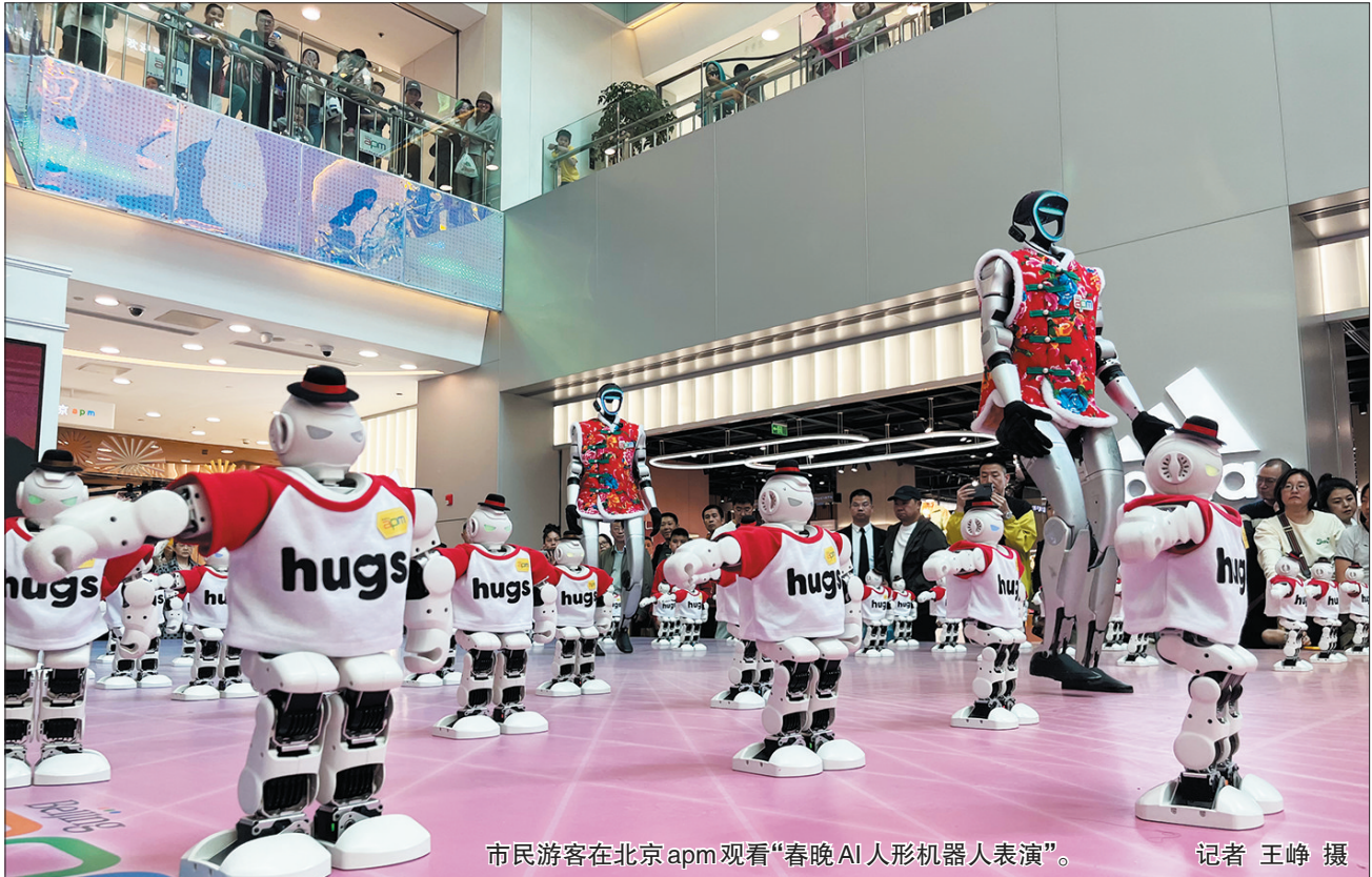
市民游客在北京apm观看“春晚AI人形机器人表演”。

近年来,随着城市更新和消费升级的不断推进,王府井商圈也在积极寻求转型升级之路。此次北京apm的机器人热舞及巡游活动,正是王府井地区管委会助力地区商家科技创新和消费升级方面的一次有力尝试。未来,王府井商圈将继续依托其独特的地理位置和历史文化优势,积极探索科技创新和消费升级的新路径,为消费者提供更加多元化、高品质的购物体验。