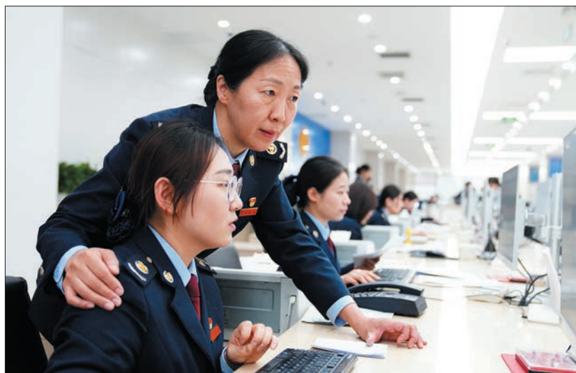
东城区设立“金燕工作室”，探索“枫桥式”税费服务新模式。