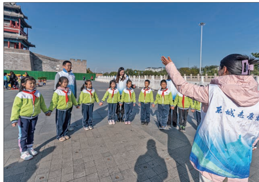
中轴线志愿者开展志愿服务。