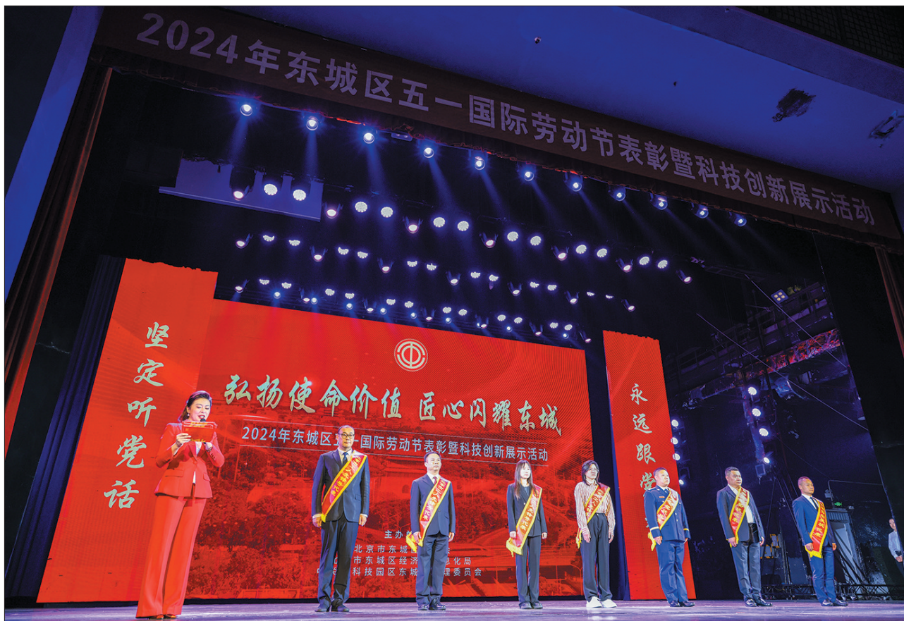
4月29日,东城区举办“弘扬使命价值 匠心闪耀东城”五一国际劳动节表彰暨科技创新展示活动。图为现场为获得劳动奖项的先进集体和个人颁奖。

东城区总工会相关负责人介绍,下一步,东城区将持续深化产业工人队伍建设改革,加快构建产业工人技能形成体系,打造一支知识型、技能型、创新型劳动大军,努力搭建多层次多形式岗位立功、劳动竞赛、科技创新等干事创业平台,支持劳模工匠和技能人才更好施展才华,大力推进健全劳动关系协调机制,深化职工服务帮扶工作,让职工群众进一步感受到党的关怀和温暖。未来,全区各级工会将团结带领全区职工大力弘扬劳模精神、劳动精神、工匠精神,在全区大力营造尊重劳动、尊重知识、尊重人才、尊重创造的浓厚氛围,为奋力谱写中国式现代化东城新篇章凝聚强大力量,以实际行动弘扬使命价值、深化“六力提升”。(相关报道见4版)