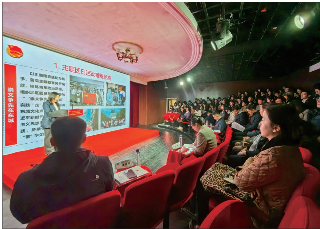
青年分享在岗位上建功的典型事迹。

2024年是完成“十四五”规划目标任务的关键之年，东城区将继续带领广大青年，不断提升引领力、组织力、服务力和大局贡献度，为打造中国式现代化建设先行区、示范区汇聚磅礴青春力量。文/记者 王慧雯