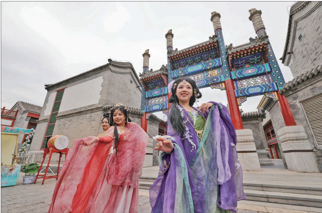
“前门国风节”展现国风雅韵之美。

5月1日起,新世界百货将在户外广场举办施丹兰产品展卖活动,在售卖独家礼盒、明星产品的同时,推出满减、免费护理等活动。摩方将邀请艺术团体走进商场,为消费者表演舞蹈和街舞,并举办迷你音乐会。