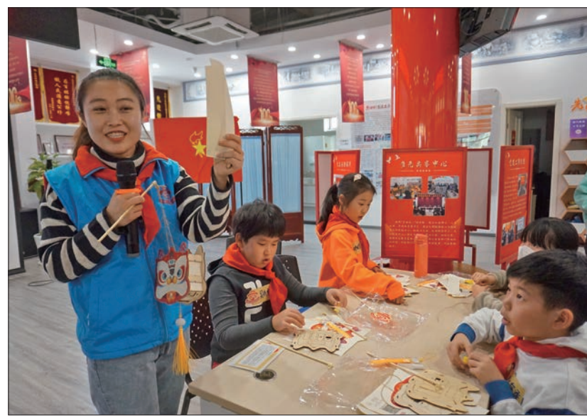
东城区少先队社区成长营开展社会实践活动。