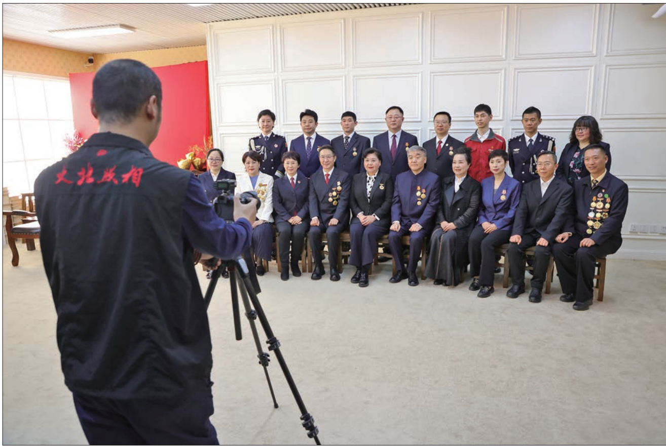
大北照相馆开展“向劳动者致敬”公益拍摄活动。