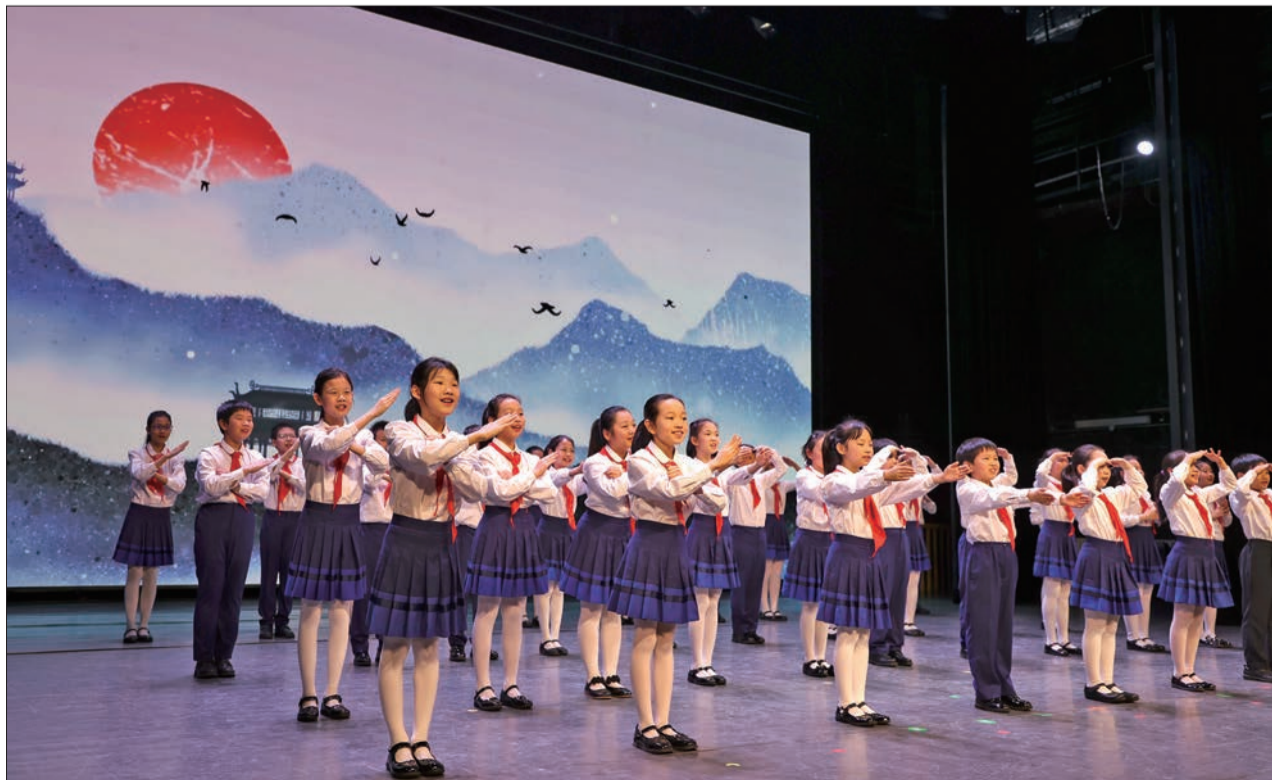
4月18日,2024东城区“世界读书日”主题活动举行。图为分司厅小学的学生们带来少儿合唱《读唐诗》。

爱国主义自古以来就流淌在中华民族血脉之中,是我们民族精神的核心,是中国人民和中华民族同心同德、自强不息的精神纽带。爱国主义教育“大课堂”是东城区结合习近平总书记关于爱国主义教育的重要论述,贯彻落实《爱国主义教育法》,盘活域内爱国主义教育基地资源的特色举措。下一步,东城区将持续开展各类内容丰富、形式多样的爱国主义教育,引导广大干部群众及青少年传承和弘扬民族精神,自觉培养爱国之情、砥砺强国之志、实践报国之行,为实现中华民族伟大复兴的中国梦不懈奋斗。