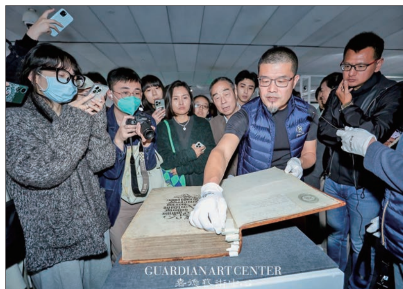
策展人向记者介绍展出的插图版书籍《纽伦堡编年史》原件。

据悉,此次“奇想集”观澜国际版画收藏展将于4月20日至4月28日面向公众开放,开放时间为每日10时至18时(每周一闭馆)。