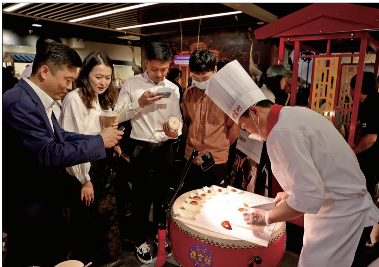
便宜坊焖炉烤鸭“新文武”饮食文化体验。

此外,森隆饭庄还计划推出更契合年轻消费者理念的“小菜馆”,打造网红打卡地。“小菜馆”的菜品会更加注重时尚、健康,数量上则会更加精简,用餐环境更加轻松。森隆将通过与年轻消费者建立更加紧密的联系,进一步拓展市场份额。“森隆饭庄相关负责人说。