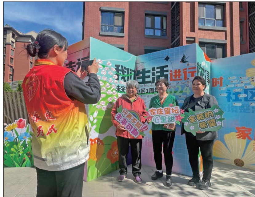
居民在“幸福生活进行时”展板前合影。

“望坛作为北京市核心区最大的改造项目,首批居民2000多户已经入住一年。街道将工作重点放在了进一步提升和保障老百姓生活便利性上,像社区底商刚刚引入了新的业态——京东便利店,就是为了给居民提供更便利的生活服务。在小区规划阶段我们就已经配建了一所小学、两所幼儿园,其中的小学已经正式启用。”永外街道相关负责人表示,今年下半年,街道还要迎接第二批和第三批回迁居民,同时在教育配套、卫生配套、商业配套、公共服务等各个方面进一步提升老百姓的生活品质。