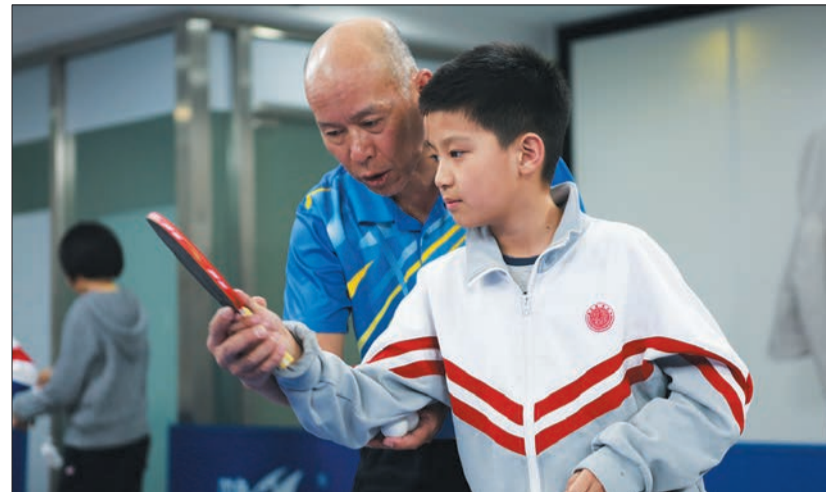
乒乓球兴趣小组学员跟随专业教师学习握拍技巧。

此外,东城区少年宫还开发了涵盖民族艺术普及与实践、高水平艺术团、传统文化、人文素养等9大类104个项目的特色课程与活动。区少年宫开展的课程及活动辐射全区32所中小学,75名教师累计提供每周118人次课后服务活动,每周服务学生近3000人。