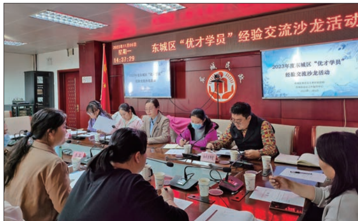
社工在“传习社”参加专业知识培训。