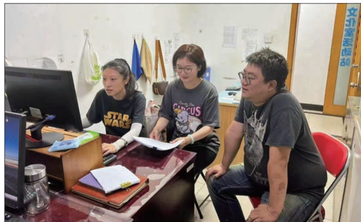
“优才计划”项目组成员商议推进社区工作。

区级社会工作指导中心打造了东城社工“传习社”,以线上、线下相结合的方式开展培训,传习社会工作专业知识。推进“优才计划”试点工作,搭建“东城社工优才工作坊”,深入发掘和培养本土优秀社区社会工作人才。开展区级本土社工种子选拔,促进队伍专业化、职业化发展,为加快推进核心区高质量发展提供坚强人才保证。