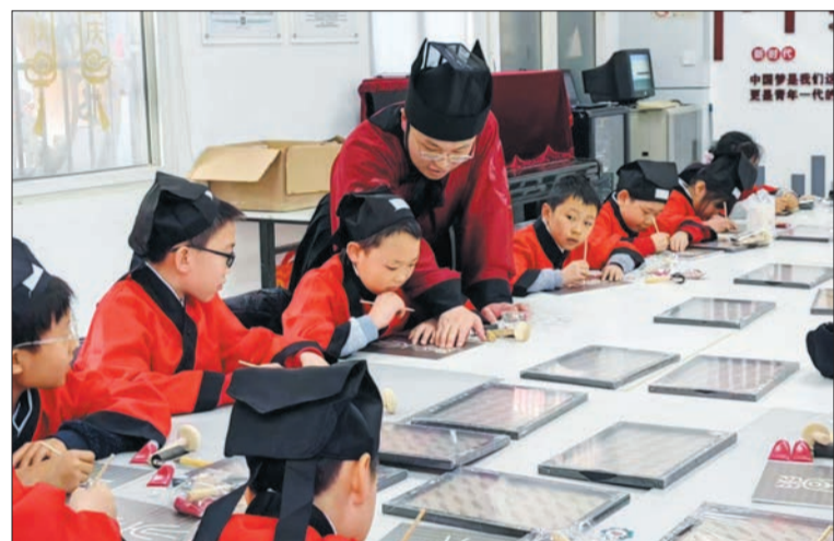
龙潭街道举办国学文化进社区活动。