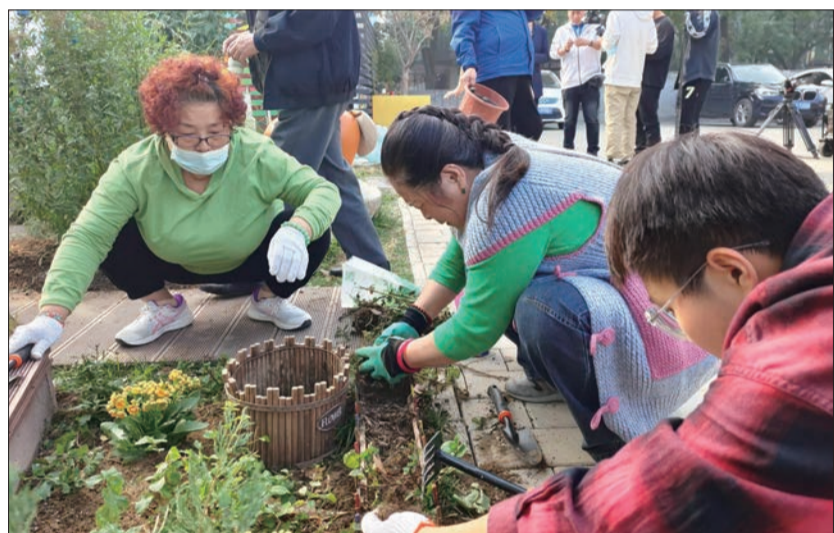
景山街道居民日常维护“微景花园”。