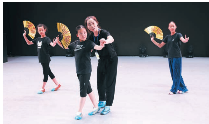
中国舞兴趣小组学员在老师的指导下练习舞蹈。