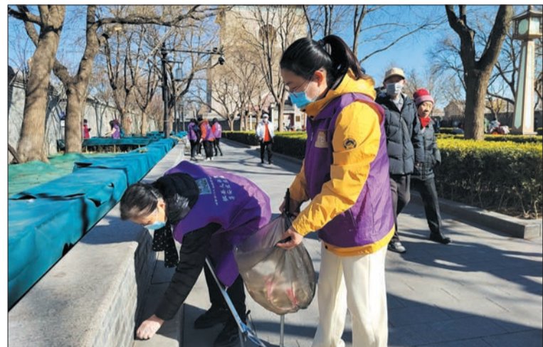
安定门街道发动“甜葡萄”志愿者等力量清扫绿地。

文明贵在养成，文明重在实践。连日来，全区上下扎实开展精神文明建设工作，不断提升群众幸福指数。大街小巷干净整洁、志愿服务蔚然成风、绿色理念深入人心……一项项丰富多彩的新时代文明实践实践活动，用实际行动推动精神文明建设提质增效，让“文明之花”开遍东城、处处绽放。 文/记者 李滢 李冬梅 王慧雯