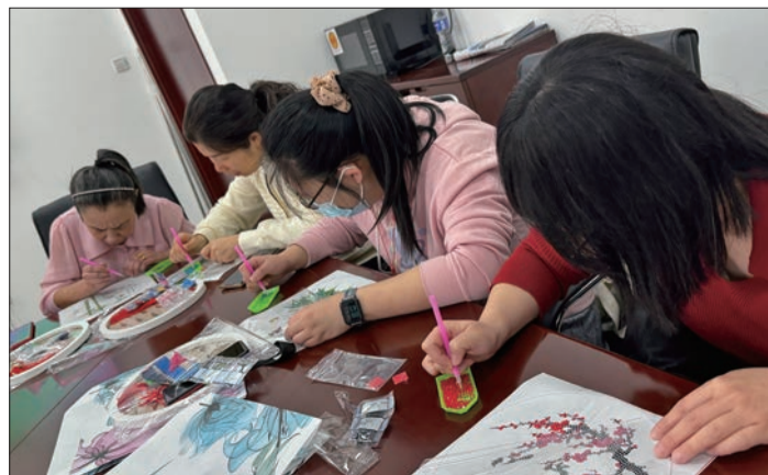
龙潭街道组织社工开展文化与心理团建活动。