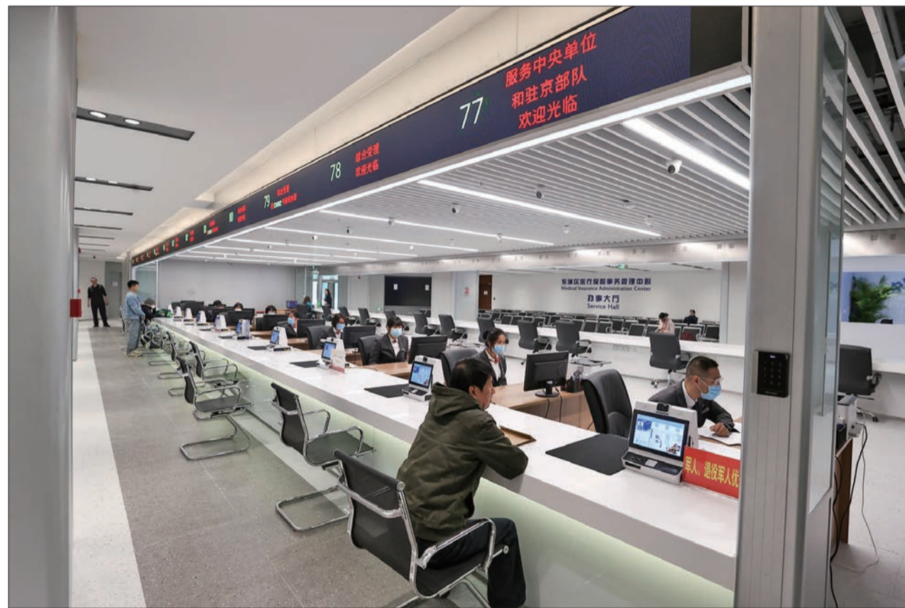
3月18日,东城区政务服务中心在新址开厅运行。图为工作人员为市民办理业务。

伍建设。要引导统战人士深入调查研究、积极建言献策。要深化区域化统战和“同心东城”多党合作品牌,积极探索“党建+统战”东城路径,团结引领新阶层人士参与城市基层治理。 六是推进建设更高水平的平安东城、法治东城。要聚焦重大活动安保维稳任务,加快构建核心区政治安全立体化防控新格局。要继续坚持和发展新时代“枫桥经验”,巩固并推广“矛调处置一体化”等创新经验和实践成果,全面深化政法领域改革,推动严格执法、公正司法、全民守法。要锻造忠诚干净担当的高素质政法铁军,突出抓好政法机关政治建设,做实政法队伍教育整顿的“后半篇文章”。