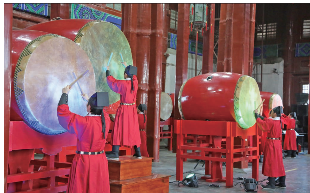
钟鼓楼“甲辰龙年钟鼓楼迎春”活动中上演《天地之和》击鼓表演。