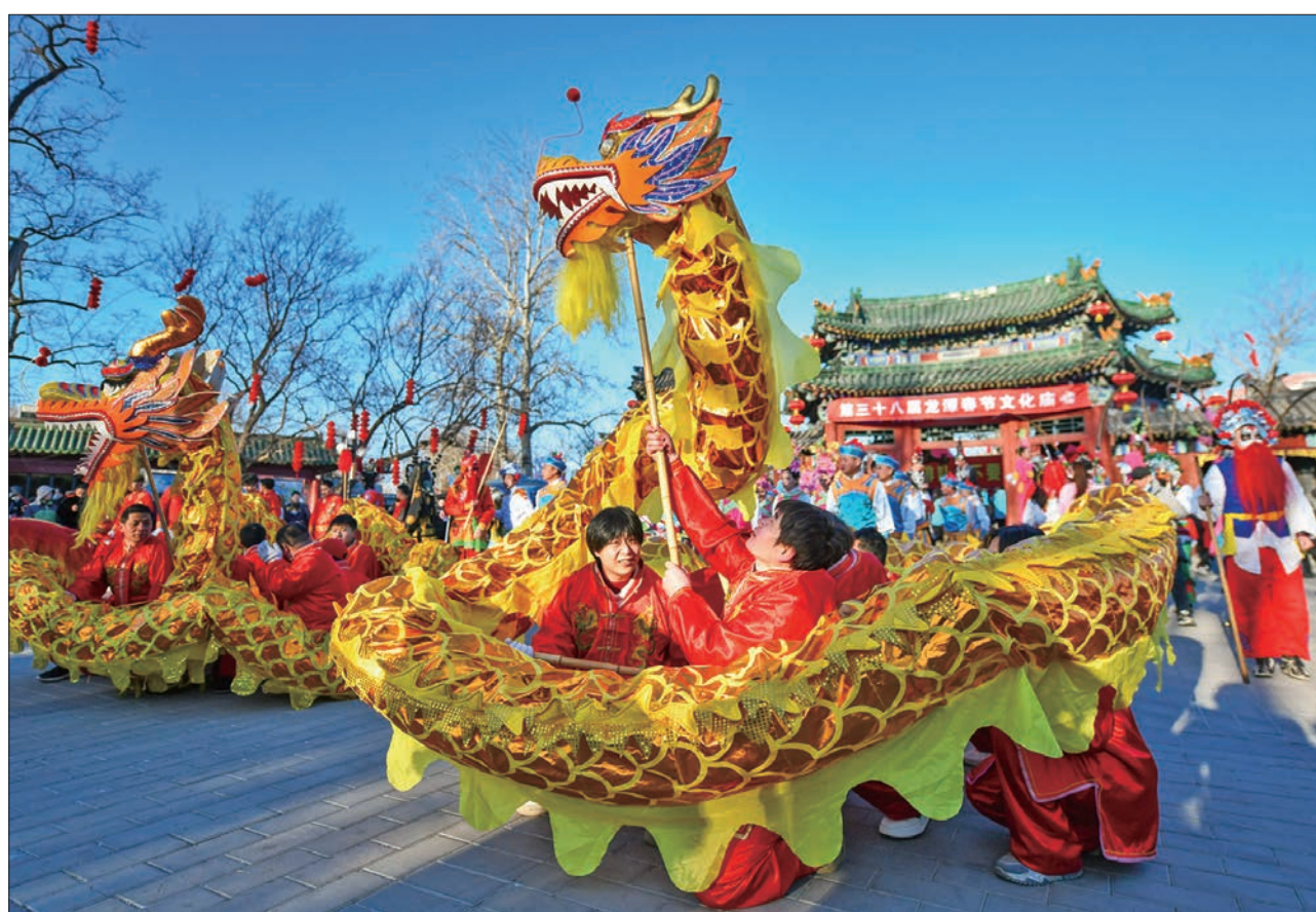
睽别四年,第三十八届龙潭春节文化庙会、第三十六届地坛春节文化庙会喜庆回归,为市民游客带来那股熟悉的京城年味。图为龙潭春节文化庙会在大年初一盛装开场。

文化活动精彩纷呈,消费市场购销两旺,服务保障周密到位,文旅市场平稳有序 浓浓“文化味”过大年 遍地“烟火气”迎新春