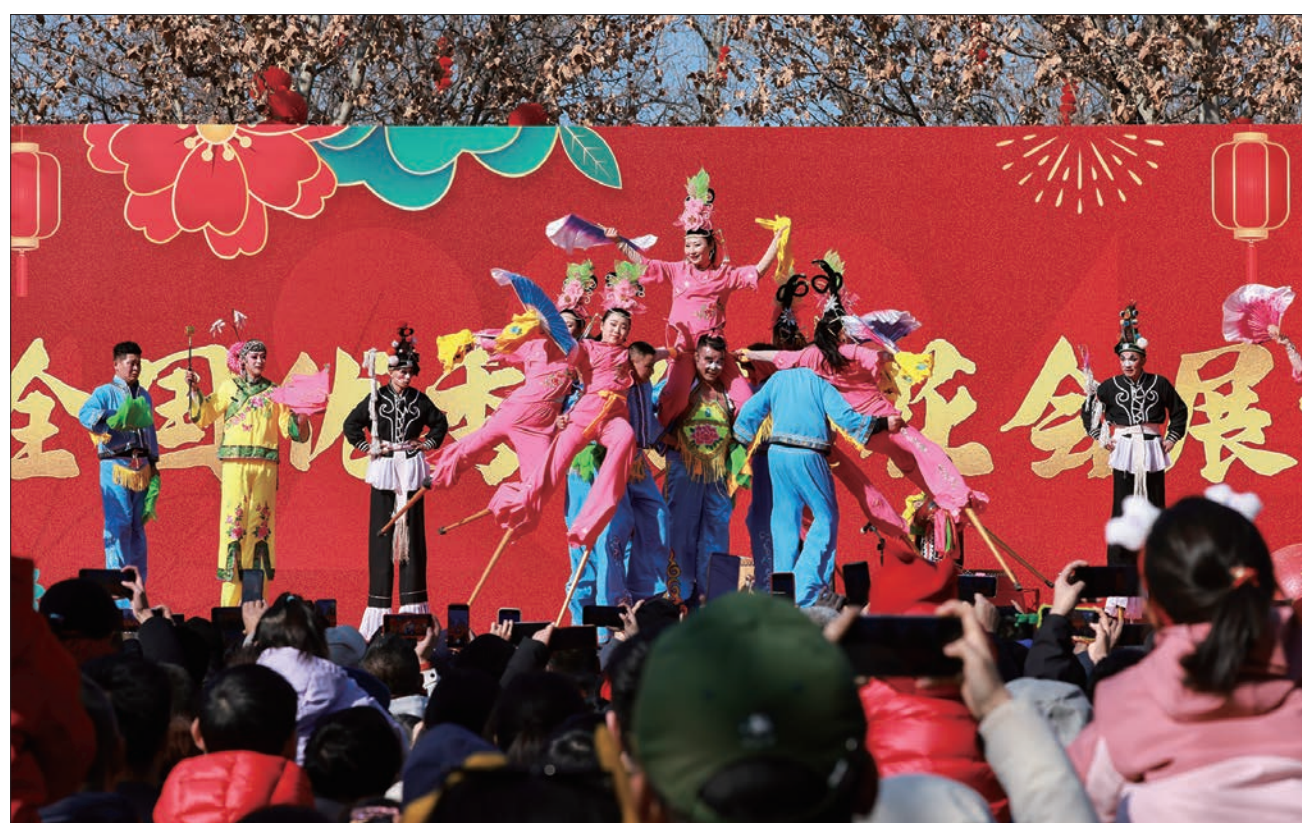
龙潭庙会传统花会表演深受观众欢迎。

老北京糖画、风车、皮影、兔儿爷等非遗项目分散于“齐乐龙龙”欢乐市集,来逛龙潭庙会,就一定不要错过这些非遗艺术品。龙潭春节文化庙会作为京城著名庙会之一,以体育、公益、民俗等特色独树一帜。汇聚多元主题、创新潮流表演,创意融合文化元素,突出文化传承,将春节民俗传统文化与潮流文化有机融合。传统花会表演、综艺演出、体育大擂台、冰雪娱乐、国风电竞、棋类对弈……丰富的沉浸互动体验活动,为游客奉上了一场春节期间的文化盛宴。