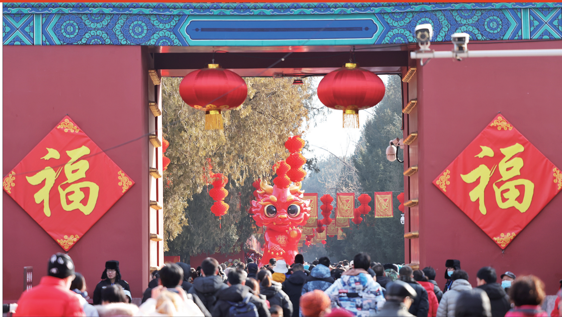
地坛庙会以“春望方泽·龙跃凤鸣”为主题,累计客流量达到近百万人次。