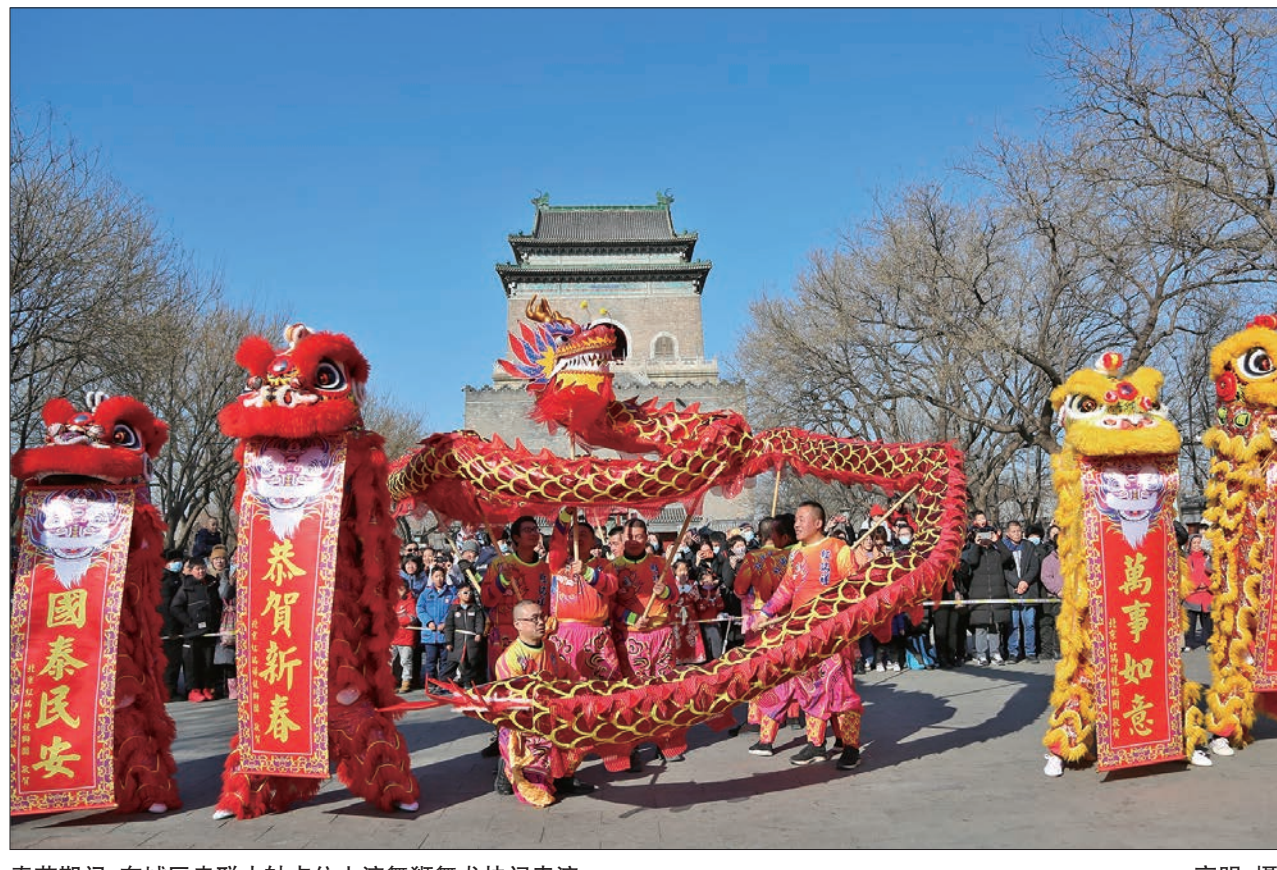
春节期间,东城区串联中轴点上演舞狮舞龙快闪表演。

龙年春节期间,东城区各大文化活动现场热闹非凡,各大商圈喜气洋洋,年味、京味、文化味集中呈现,营造了红红火火的节日文化氛围。睽别四年,第三十八届龙潭春节文化庙会、第三十六届地坛春节文化庙会喜庆回归,整体客流分别达到六十万和近百万人次,创下了客流新高。同时,以“故宫以东”过大年”为主题的114项、262场新春系列文化活动轮番登场,藏于春节年味中的“文化味”愈发浓郁,充分展现全国文化中心核心区的首善气象。