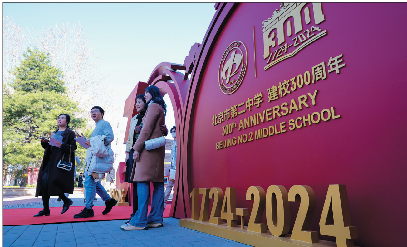
3月30日,北京市第二中学举办建校三百周年大会,回顾学校发展历程,共话教育高质量发展。

2024年,东城区将全速推进“崇文争先”,以实际行动弘扬使命价值,不断完善行政权力运行机制,持续建设一流营商环境,有力推动法治领域改革创新,将政府工作全面纳入法治轨道,助力谱写中国式现代化的东城新篇章。