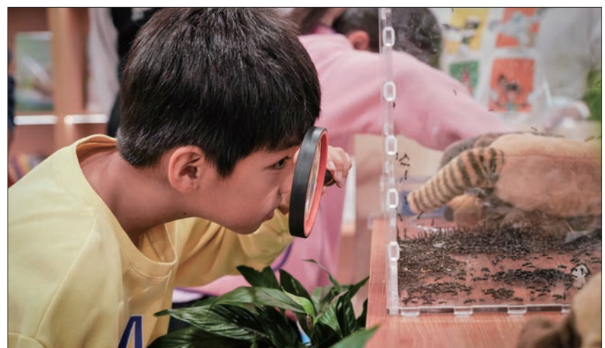
小朋友手持放大镜近距离观察昆虫的生活习性。