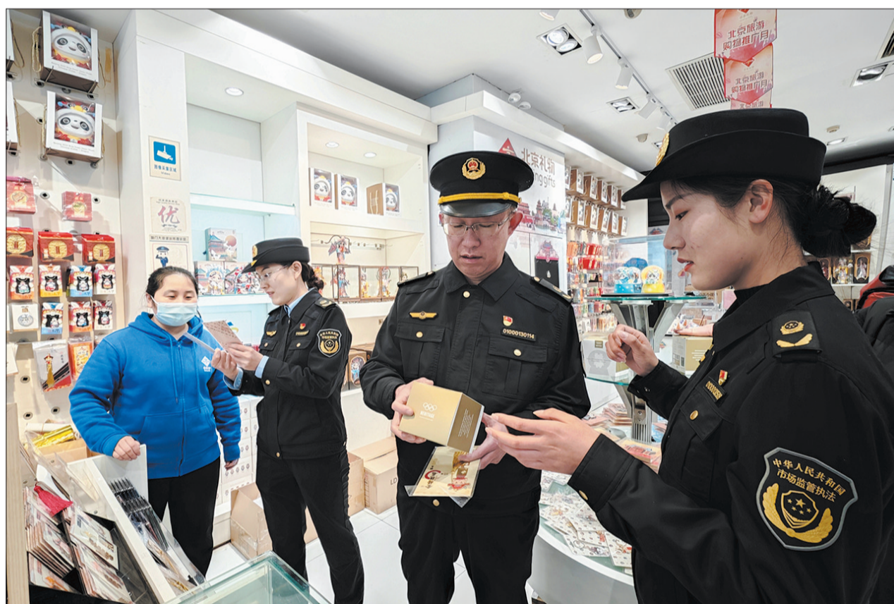
执法人员在前门大街的一家文创店检查旅游商品质量。

随着隆福寺二期项目竣工,隆福寺街也以全新形象亮相,实现东西贯通。同时,一期和二期项目的公共空间连成一片,形成了宽阔的广场,带来了更多休闲空间。