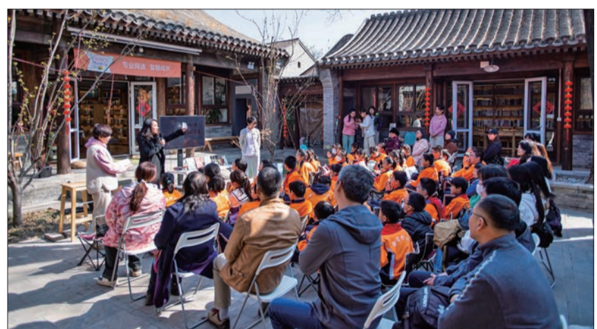
你好阅读为东城区分厅小学举办家校阅读实践活动。

4月2日是国际儿童图书日,也是中国儿童阅读日。记者日前探访4家东城区儿童阅读空间,发现它们在经营理念、功能分区、主营事项等方面各有不同,各具特色,核心相同之处是为少年儿童的专业阅读做好服务与支持。文/记者 洪珊