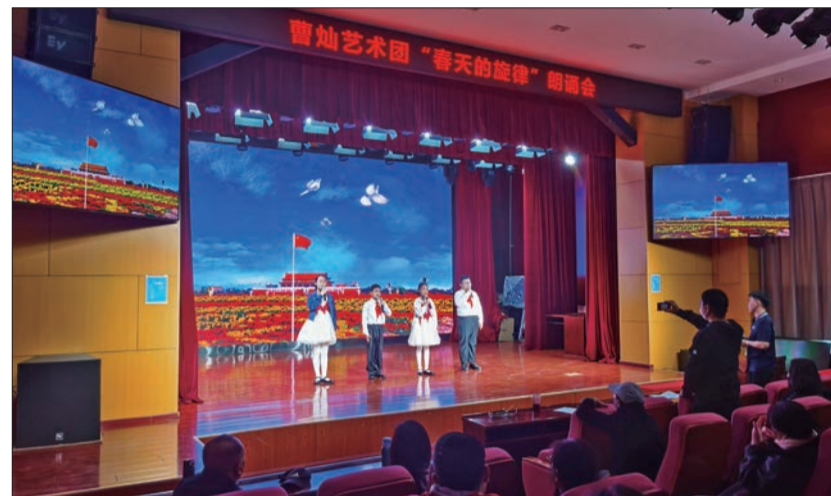
东花市街道联合曹灿艺术团开展春日主题朗诵会活动。