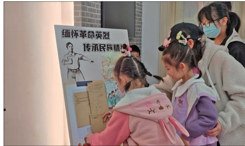
北大二院旧址(原北大数学系楼)举办清明节纪念活动。

各街道、社区将贯彻绿色发展理念,大力推广敬献鲜花、绿化植树、集体共祭、家庭追思等文明低碳祭扫方式,引导广大市民以实际行动表达敬仰追思,弘扬时代新风。青年湖公园将组织义务植树和树木认养活动,向游人宣传“爱绿护绿”理念,市民可以选择以植树、种花等形式,表达对逝者的缅怀之情,同时也为城市增添一抹绿色。