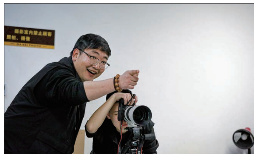
摄影师张磊在拍摄过程中调动孩子的情绪。

“摄影是一门充满魅力和创意的艺术,它不仅是一种记录生活的方式,更是一种表达情感和传递故事的工具。未来,我将持续学习和不断创新,用丰富的产品让百年老店历久弥新。”张磊说。 文/记者 庄蕊