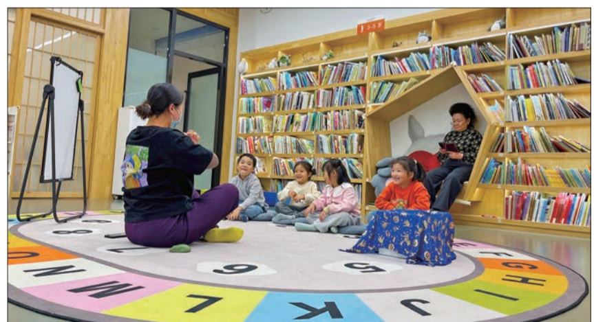
在悦读奇缘(六壹广场馆),老师带着孩子们上中文故事会。