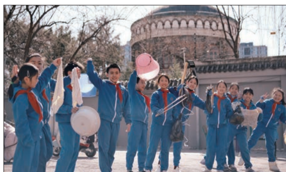
史家实验小学学生参与社区环境清理工作。