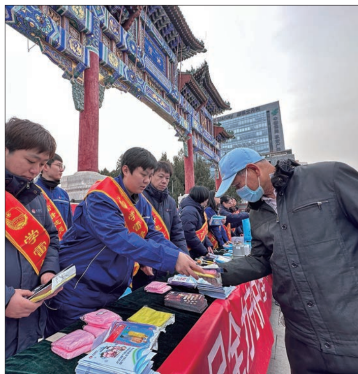
和平里街道开展“志愿服务一条街”活动。