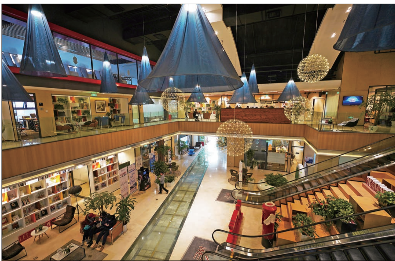
德必天坛 WE"文创园区。