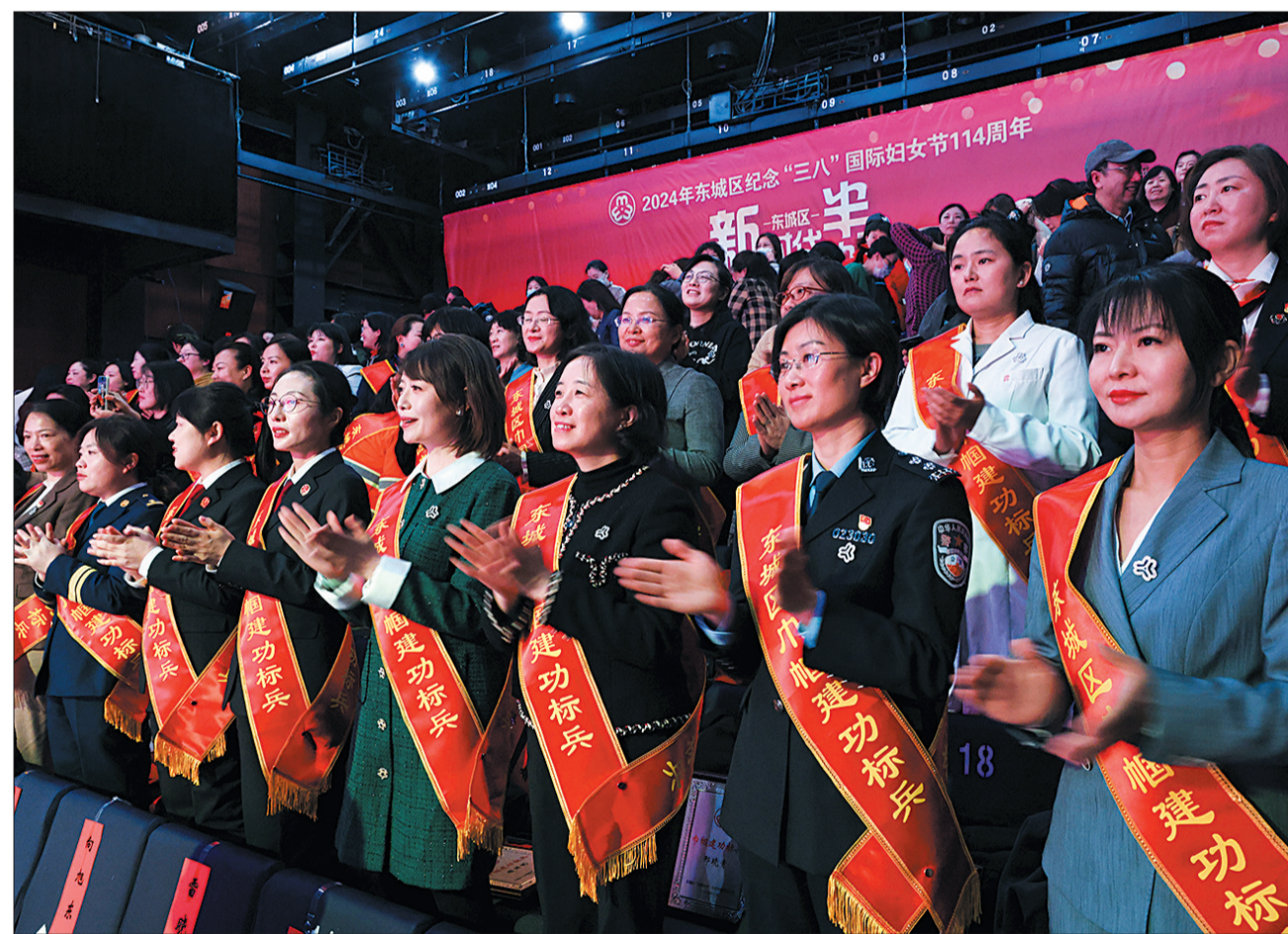
会上,对25名“巾帼建功”标兵代表和25名巾帼文明岗代表进行表彰。