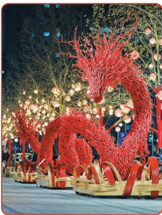
瑞士公寓地景艺术装置《瑞龙启岁》。