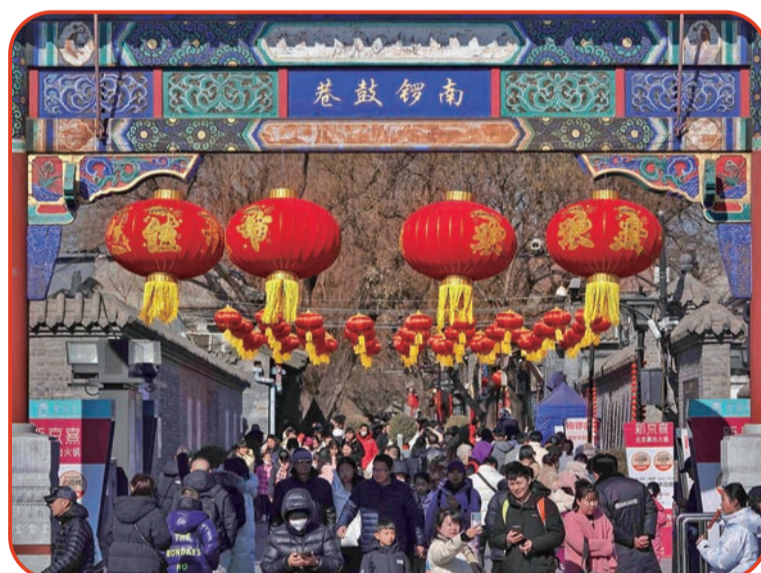
南锣鼓巷游人如织。