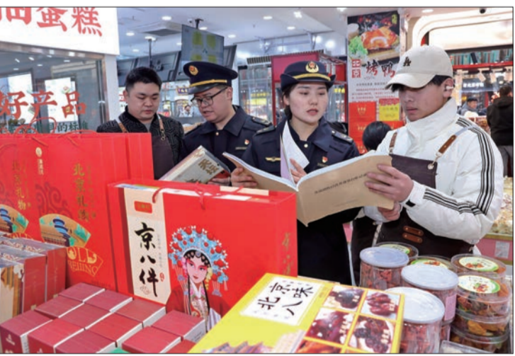
执法人员对景区周边经营主体开展执法检查。