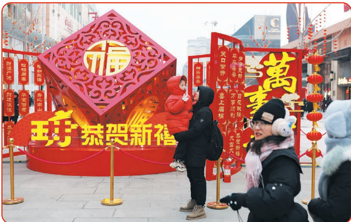
市民游客在王府井大街“四方平安”景观小品前合影。