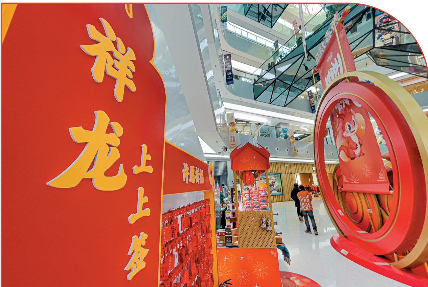
东直门商圈来福士购物中心春节期间将举办“祥龙游园会”主题活动。