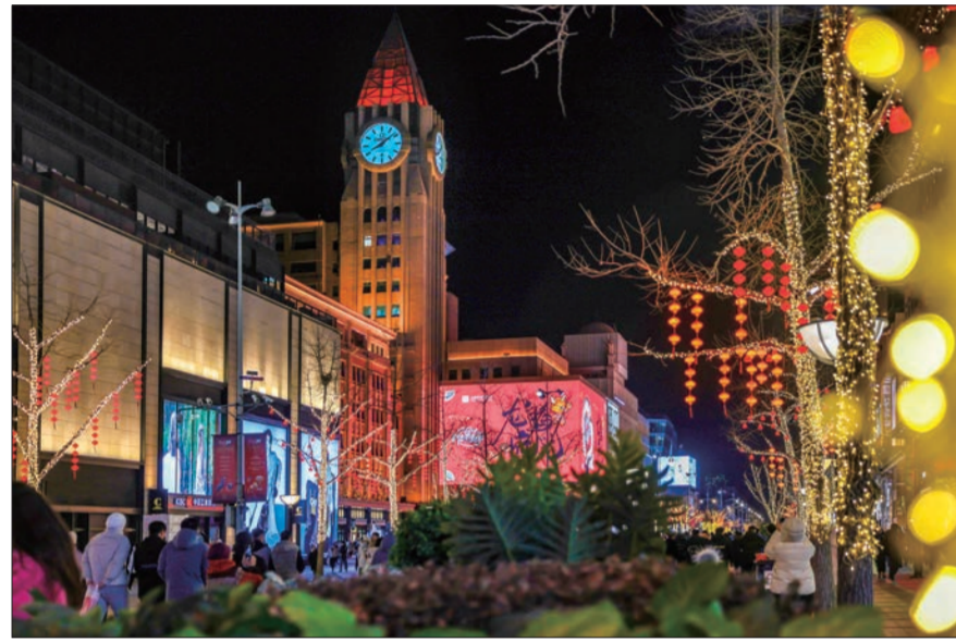
王府井大街张灯结彩,年味浓厚。

“故宫以东”过大年,“有声有色”迎新春。连日来,东城区按照“营造红红火火春节氛围和浓浓年味”要求,坚持以首善标准做好春节期间各类文化活动,切实满足市民游客欢乐喜庆过大年的美好期待;以创新方式开展促消费工作,让市民游客品味传统文化与现代商业交相辉映的节日盛宴;全面细致抓好城市运行各项工作,护航市民游客安心安全过节。