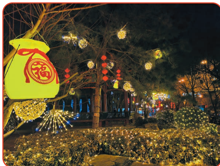
张自忠路口景观布置。