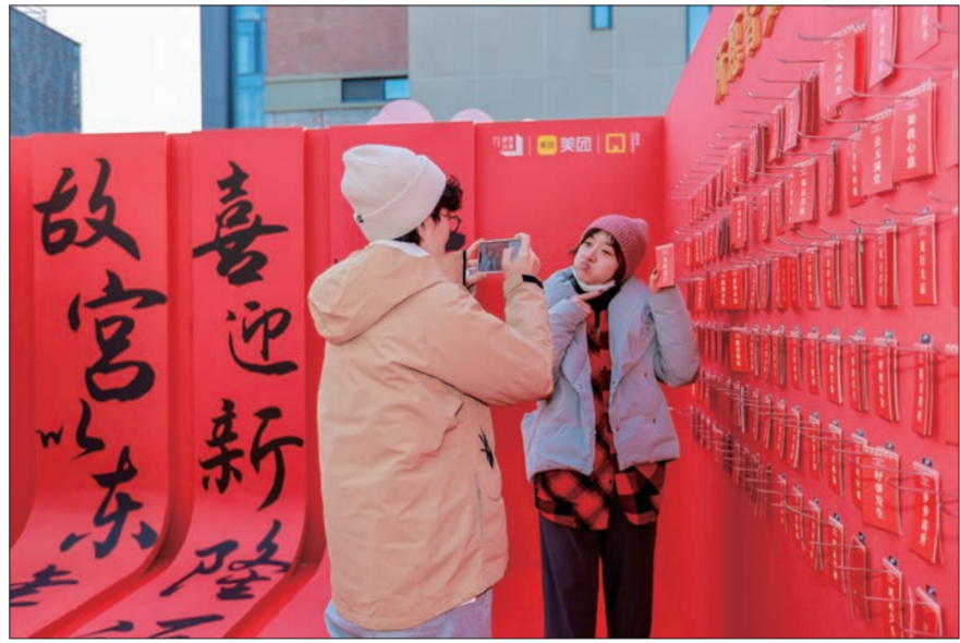
市民在隆福寺商圈“故宫以东·好运福处”拍照打卡。