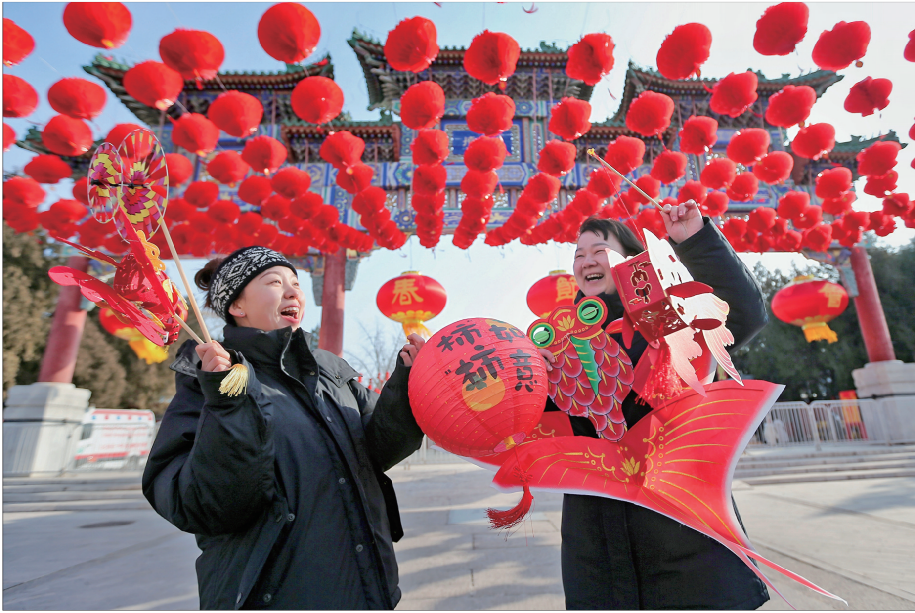
地坛庙会准备就绪,市民在大门前拍照打卡。