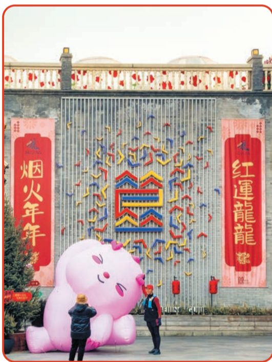
簋街288广场“红运龙龙 烟火年年”大幅新春对联和龙型气膜装置。