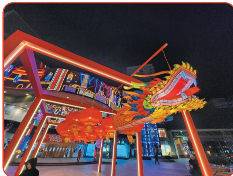
崇文门商圈新世界百货龙年新春氛围浓厚。